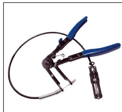
Pince à cliquet souple pour collier à ressort