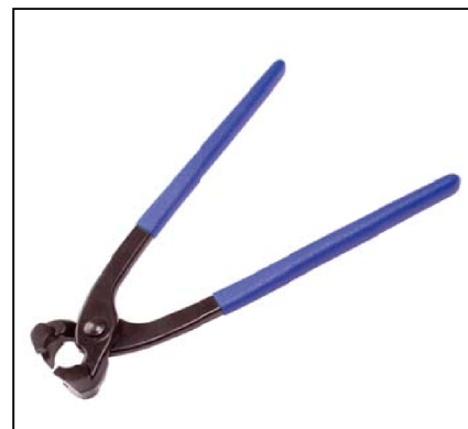
Tenaille pour collier à oreille