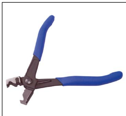
Pince verticale pour collier Clip