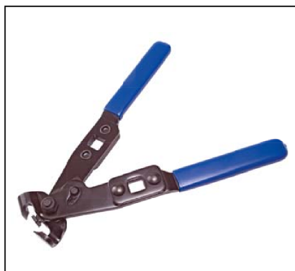
Tenaille pour collier à oreille