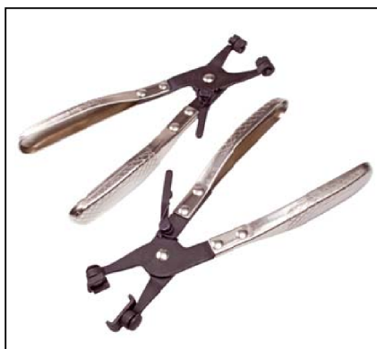
2 Pincettes pour collier à ressort