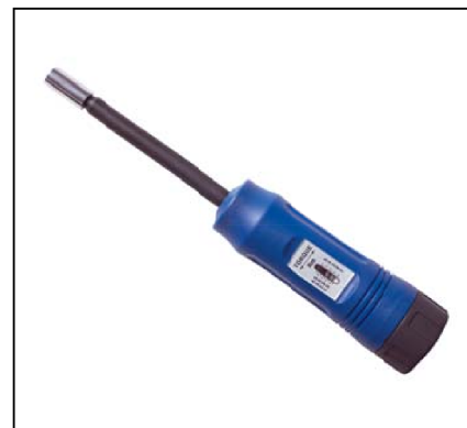
Tournevis dynamométrique pour collier à vis six pans diamètre 6/7/8mm