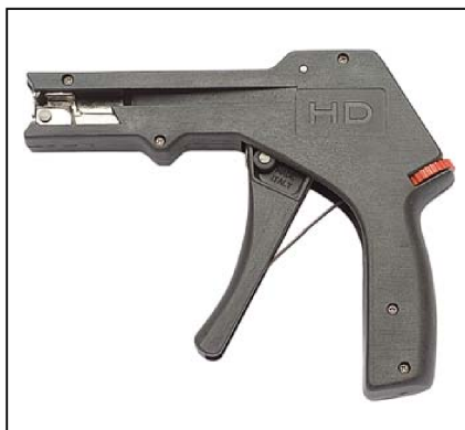
Outils de serrage et de coupe pour collier en Nylon 4.8 - 7.8mm