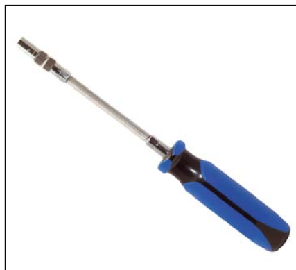
Tournevis pour collier à vis six pans diamètre 6/7mm