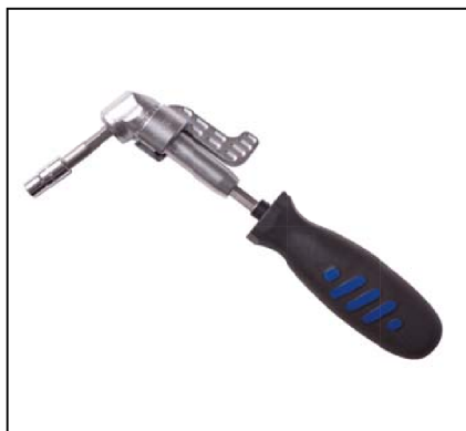
Tournevis d'angle pour collier à vis six pans diamètre 6/7/8mm