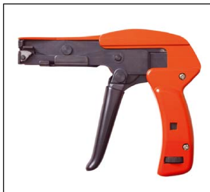
Outils de serrage et de coupe pour collier en Nylon 2.2 - 4.8mm