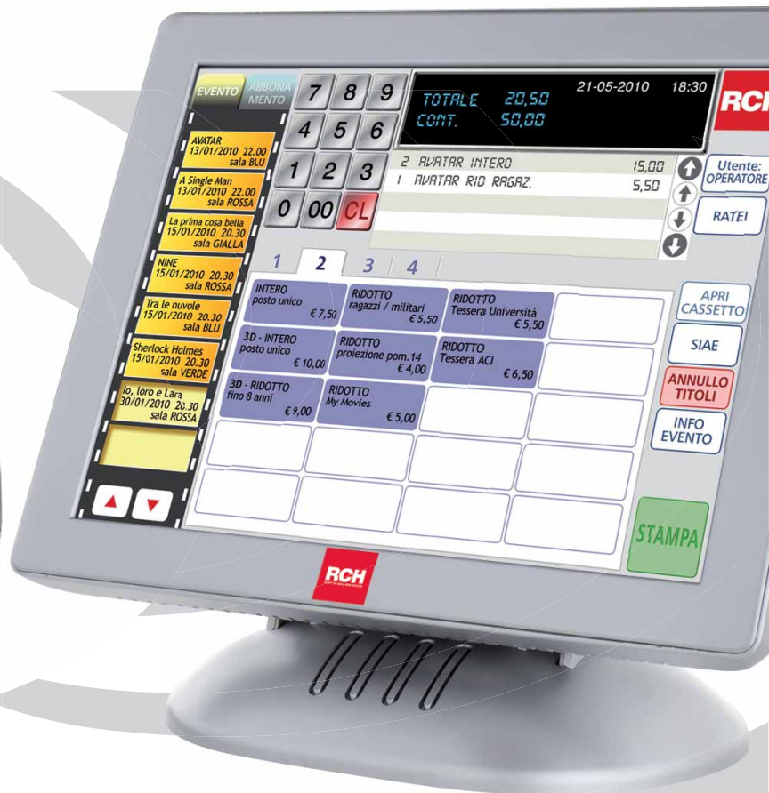
unità My Movie 24px18,5bx13h cm