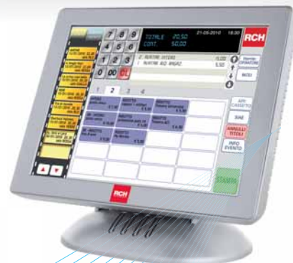
Monitor touchscreen RA15"