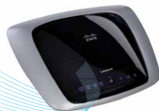
Modem / Router ADSL