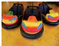
AUTOSCONTRI E KART