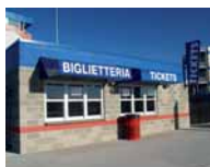
EMISSIONE CONTO TERZI

La “Legge Spettacoli ed Intrattenimenti” * impone agli esercenti di attività spettacolistiche e di intrattenimento di emettere “titoli di accesso” tramite Biglietterie Automatizzate .