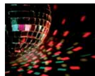
SALE DA BALLO