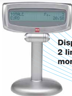
Display cliente LCD 2 linee x 20 caratteri, monofacciale, ALTO