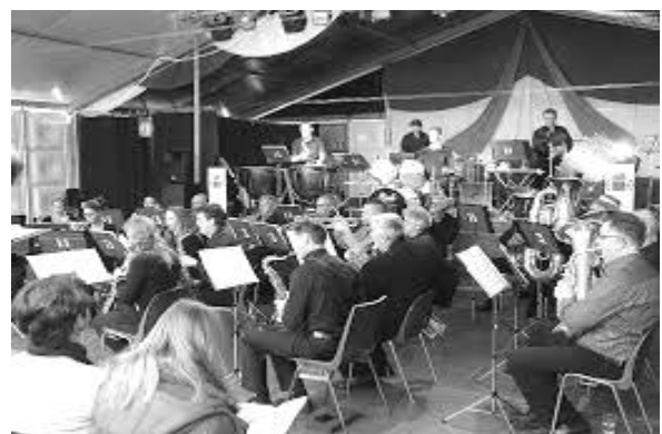
Crescendo in feesttent Muiden