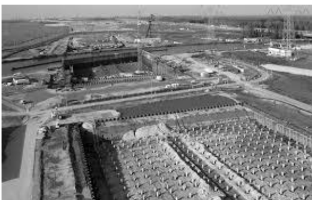
Bouwput Aquaduct Muiden

Voor wie het leuk vindt om deze Bevrijdingsdag in stijl te vervolgen: om 12.00 uur is er vanwege Bevrijdingsdag een openluchtconcert van Crescendo bij de sluis in Muiden.