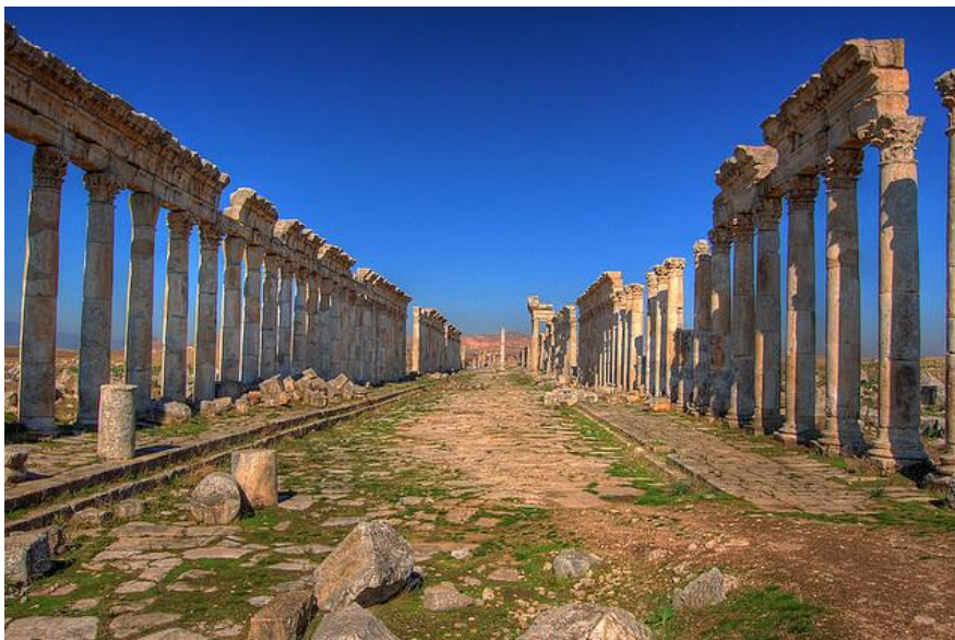
De noord-zuid as van Apamea, Syrië

In alle Romeinse steden ligt het forum op het kruispunt van de twee belangrijkste straten van de stad: de cardo en de decumanus . De cardo loopt van noord naar zuid, de decumanus van oost naar west. Volgens de Romeinen hebben cardo en decumanus een kosmische betekenis. Zij verwijzen namelijk naar hemellichamen in het heelal. Zo maakt de noord-zuid richting van de cardo deel uit van de meridiaan die zich naar de poolster richt. De decumanus weerspiegelt de zonneweg. In het oostelijke verlengde van de decumanus gaat de zon op, in het westelijke verlengde verdwijnt de zon achter de horizon. Door de noord-zuid en oost-west oriëntatie van het wegennet van de stad maken alle tempels, gerechtsgebouwen, theaters, amfitheaters en huizen van de gemeenschap deel uit van een kosmische orde.