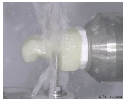
Das Inlay wird innerhalb weniger Minuten aus einem Keramik-Block gefräst.

Millionen Keramik-Inlays hergestellt und eingesetzt.