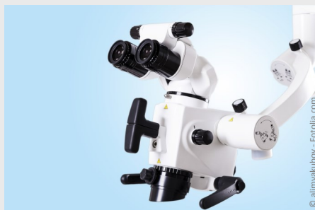
Wurzelbehandlung mit Hilfe des Mikroskops: Bis zu 25-fache Vergrößerung ermöglicht exakteres Arbeiten und bessere Ergebnisse.

Wurzelkanäle sind nur wenige Zehntelmillimeter dünn. Sie können Verästelungen, Krümmungen oder Stufen haben. Mit bloßem Auge sind solche Feinheiten nicht erkennbar. Deshalb werden sie leider oft übersehen.