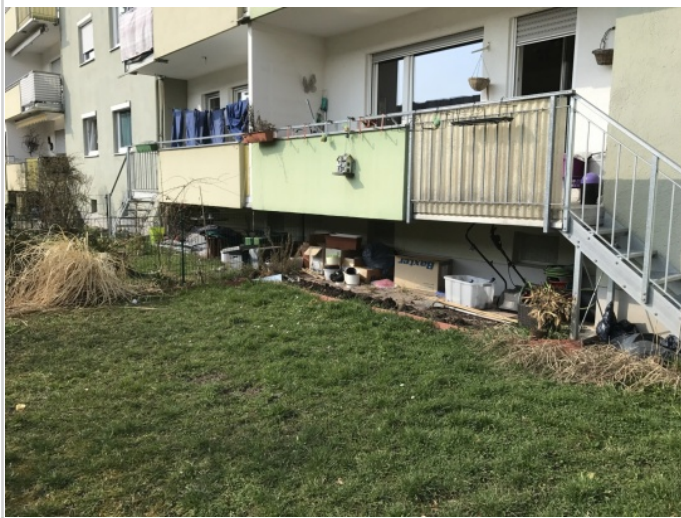
Zugang zum Garten

Zimmer: 3,00 Wohnfläche ca.: 68,50 m 2 Kaltmiete: 950,00 EUR (zzgl. Nebenkosten) Gesamtmieta: 1.095,00 EUR