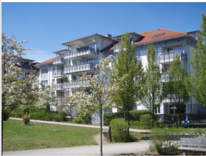
Blick in die Anlage

Zimmer: 2,00 Wohnfläche ca.: 64,40 m 2 Kaltmiete: 805,00 EUR (zzgl. Nebenkosten) Gesamtmieta: 975,00 EUR