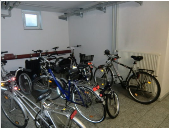
Platz für die Räder