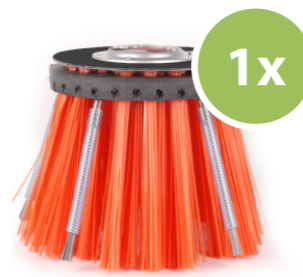
3. Weedee® onkruid borstel Haalt onkruid en mossen van het oppervlak en van tussen de voegen.