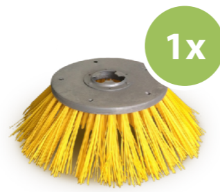
4. Terrazza Sweeper Veegborstel, ideaal voor borstelen van losliggend vuil.