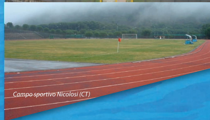
Campo sportivo Nicolosi (CT)