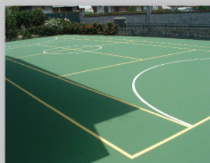
Terrazzo adibito a giochi sportivi