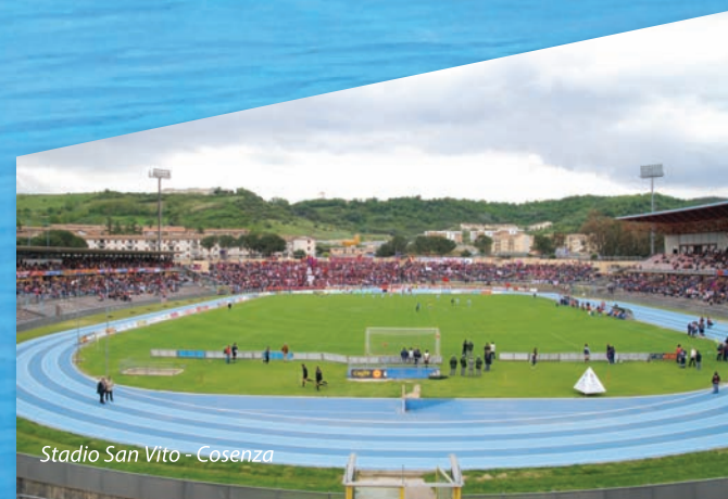
Stadio San Vito - Cosenza

Sistema di impermeabilizzazione e pavimentazione per l'edilizia e impianti sportivi