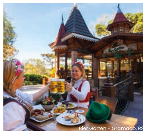
Bier Garten - Gramado, RS