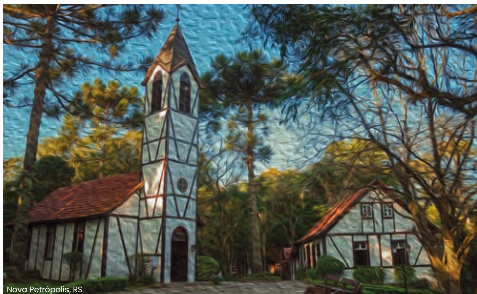
Nova Petrópolis, RS