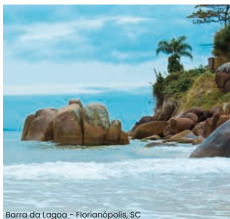
Barra da Lagoa – Florianópolis, SC