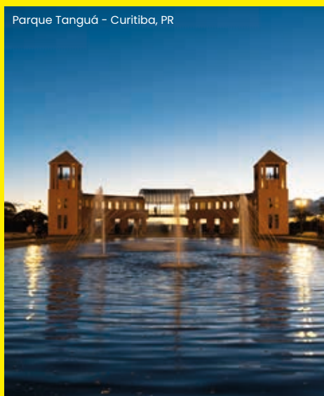
Parque Tanguá - Curitiba, PR