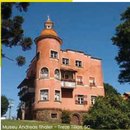
Museu Andreas Thaler - Treze Tílias, SC

Café da manhã. Às 9h00, saída para um tour panorâmico pelos principais pontos turísticos.