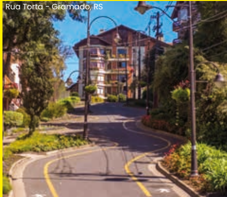
Rua Torta - Gramado, RS