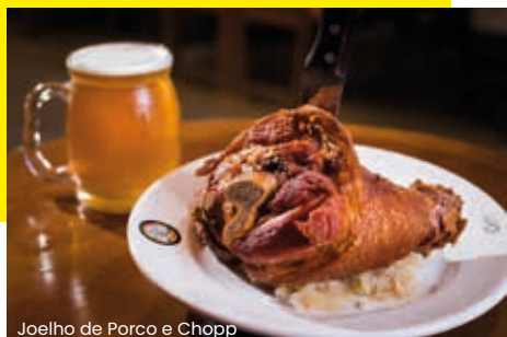
Joelho de Porco e Chopp