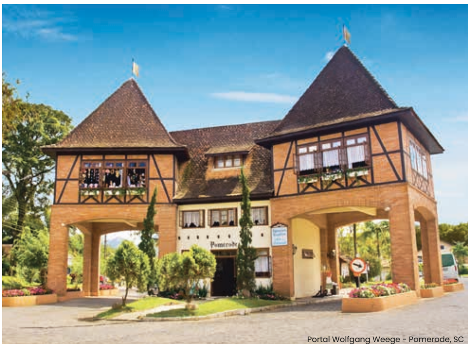
Portal Wolfgang Weege - Pomerode, SC

Faremos um breve passeio panorâmico na rota rural das Casas Enxaimel, para admirar a construção,