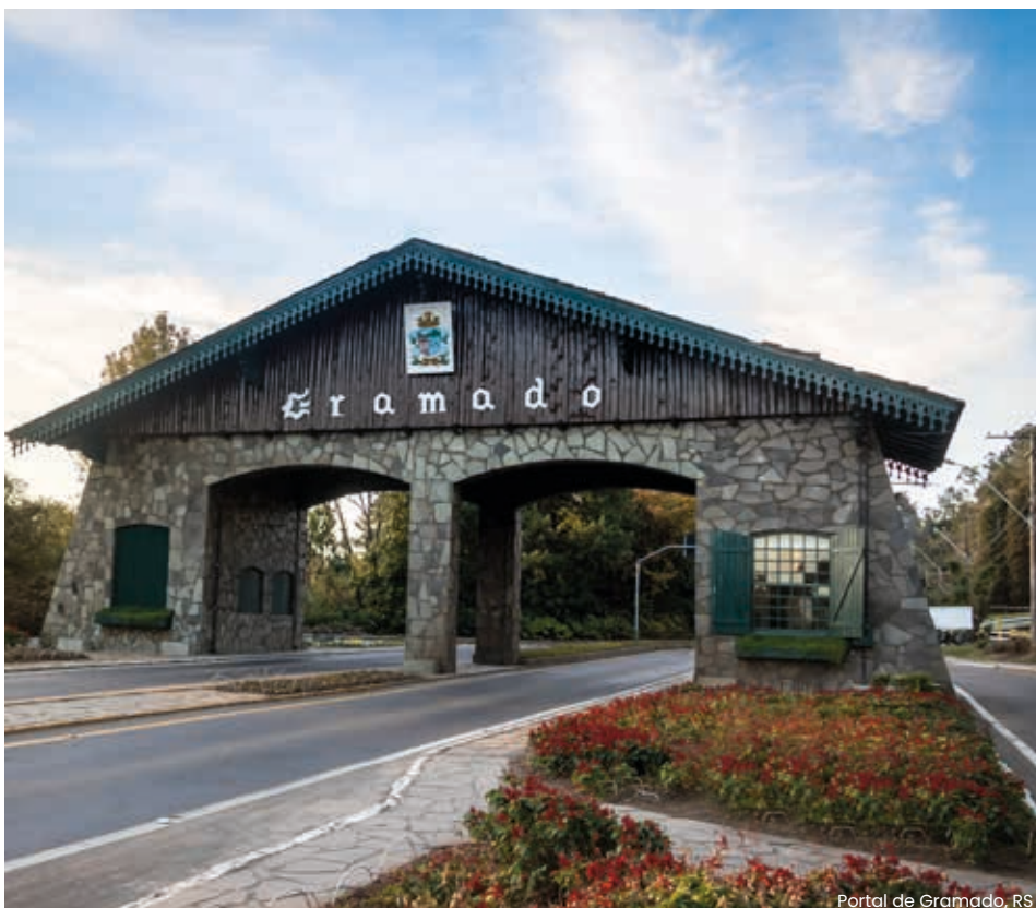
Portal de Gramado, RS

Em seguida, almoçaremos no tradicional Galeto Mamma Mia (almoço Incluído). O Galeto Al Primo Canto, a Sopa de Capeletti e a polenta Brustolada são divinos... Uma deliciosa comida e uma linda história de empreendedorismo, iniciada por um menino de 11 anos e que já queria tocar o seu próprio negócio... está curioso? Pergunte