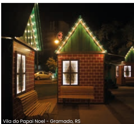
Vila do Papai Noel - Gramado, RS