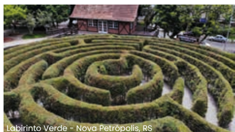
Labirinto Verde - Nova Petrópolis, RS