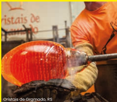
Cristais de Gramado, RS