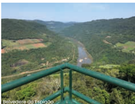
Belvedere do Espigão

Café da manhã. Às 8h00, saída para “O Tirol Brasileiro”, onde conheceremos a pequena Treze Tílias, a cidade mais austríaca do Brasil.