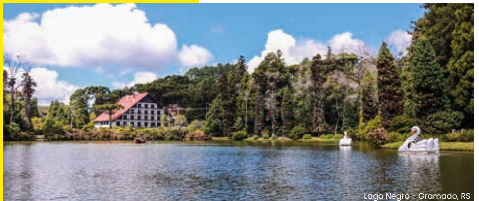
Lago Negro - Gramado, RS