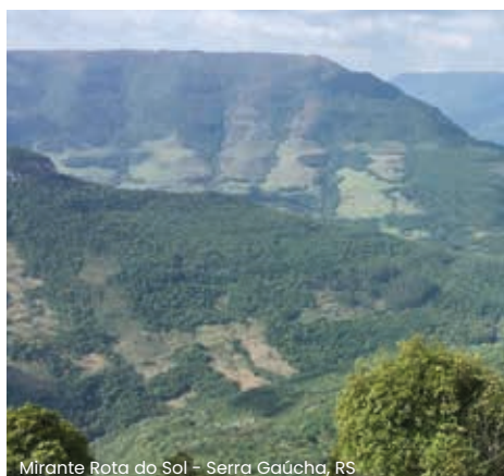
Mirante Rota do Sol - Serra Gaúcha, RS