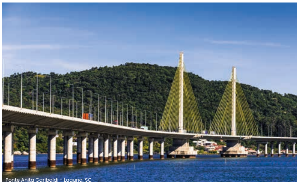
Ponte Anita Garibaldi - Laguna, SC