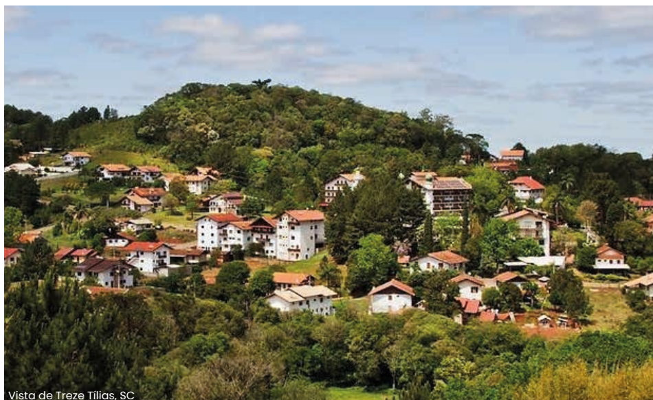
Vista de Treze Tílias, SC