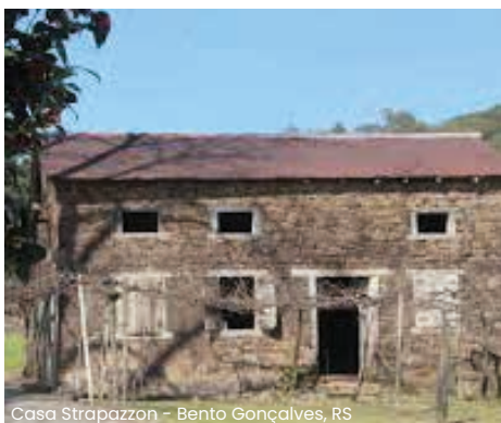
Casa Strapazon - Bento Gonçalves, RS