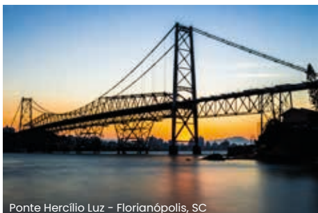
Ponte Hercílio Luz - Florianópolis, SC

Café da manhã. Às 8h00, saída para a Ilha da Magia.