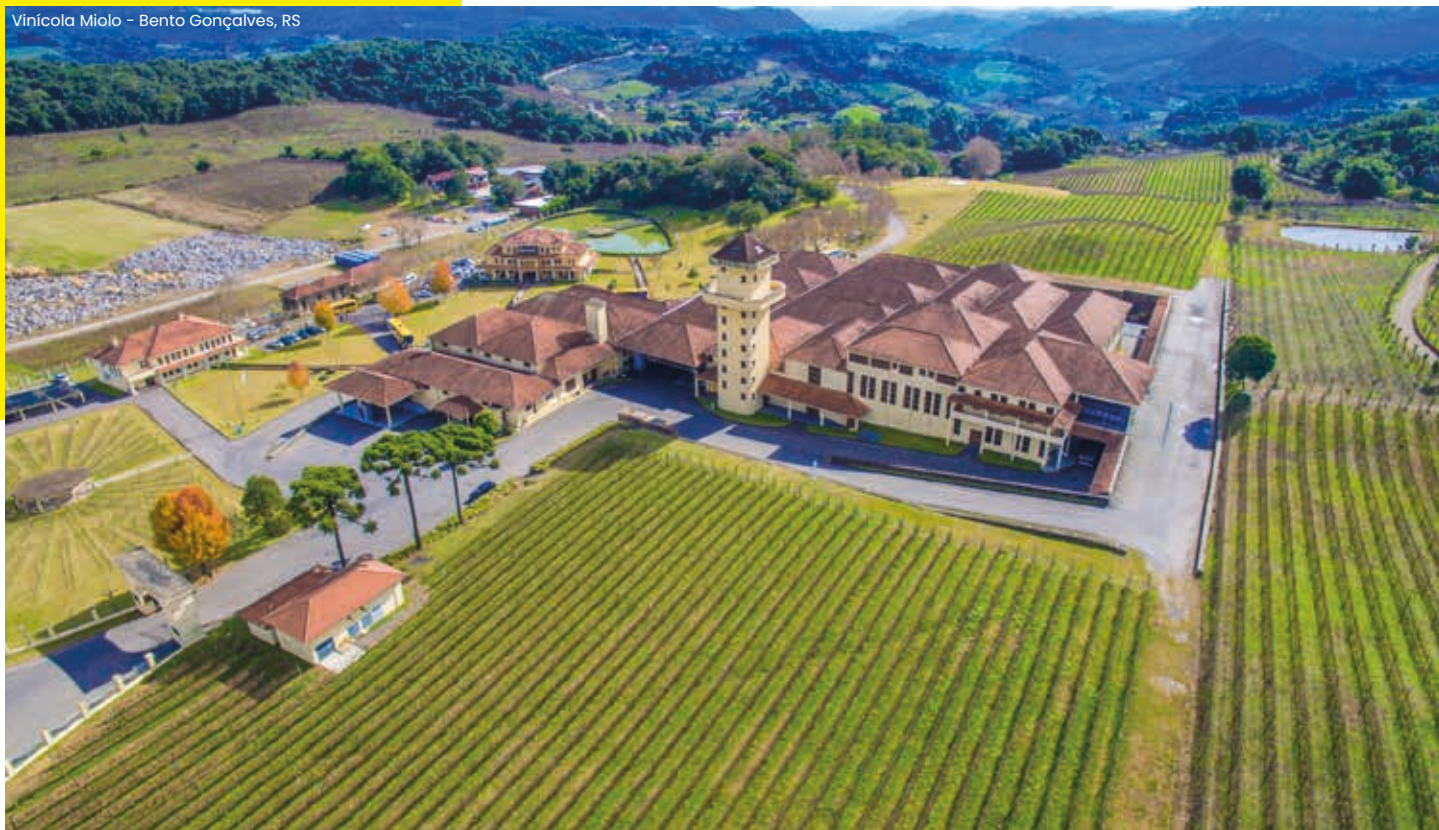
Vinícola Miolo - Bento Gonçalves, RS