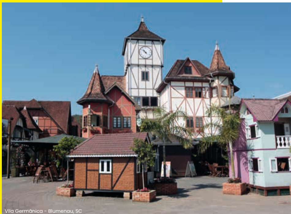
Vila Germânica - Blumenau, SC