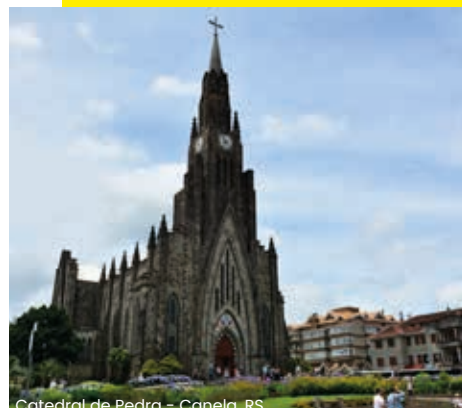
Catedral de Pedra - Canela, RS