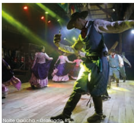
Noite Gaúcha - Gramado, RS