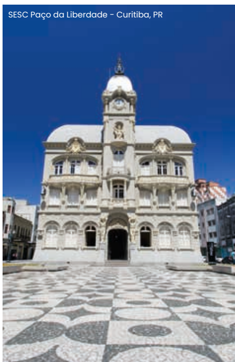
SESC Paço da Liberdade - Curitiba, PR