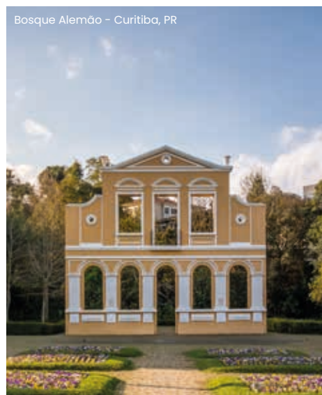
Bosque Alemão - Curitiba, PR

B em-vindo a Curitiba, capital do Paraná! Em horário a combinar, traslado do aeroporto ou rodoviária para o hotel. Dia livre para atividades do seu interesse. Recomendamos aproveitar esta noite em Curitiba para saborear deliciosos pratos da gastronomia alemã, no consagrado e animado Restaurante Schwarzwald (Jantar não Incluído). O Bar do Alemão como é conhecido, está no calçadão do Largo da Ordem, no Centro Histórico de Curitiba. Desde 1979 mantém um ambiente rústico, tradicional das tabernas germânicas, e, ao mesmo tempo alegre e descontraído. Por tudo isso, o Bar do Alemão é uma verdadeira instituição da boemia curitibana! Prost! Hospedagem.