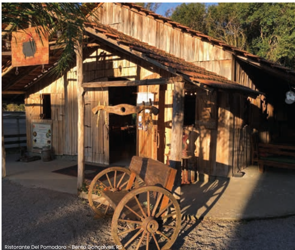
Ristorante Del Pomodoro - Bento Gonçalves, RS