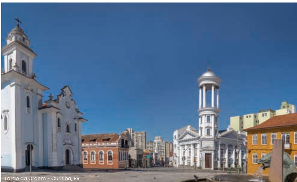
Largo da Ordem - Curitiba, PR

Curitiba, uma cidade do mundo. Após a abolição da escravatura em 1888, em apenas dez anos (de 1890 a 1900) entraram no Brasil mais de 1,4 milhão de imigrantes, o dobro do número de entradas nos oitenta anos anteriores (1808-1888).