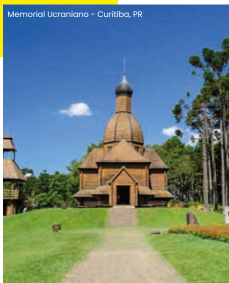
Memorial Ucraniano - Curitiba, PR