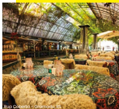
Rua Coberta - Gramado, RS