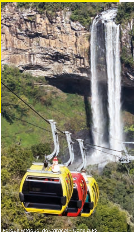
Parque Estadual do Caracol - Canela, RS