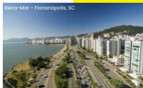
Beira-Mar – Florianópolis, SC