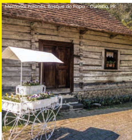
Memorial Polonês, Bosque do Papa - Curitiba, PR