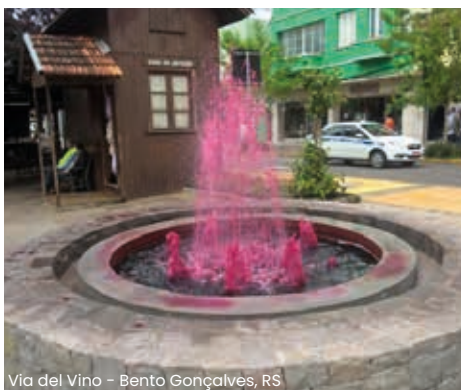
Via del Vino - Bento Gonçalves, RS