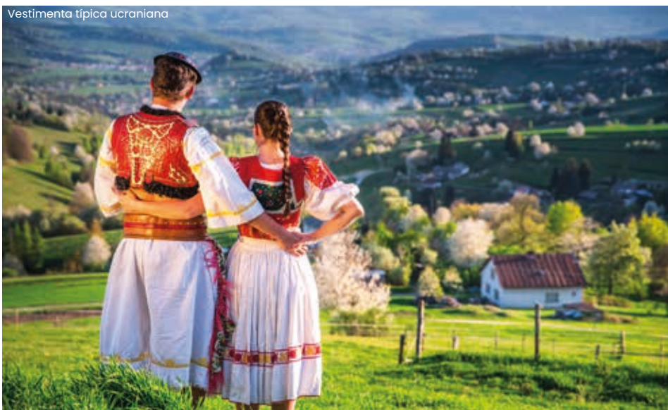
Vestimenta típica ucraniana

A maioria procedia da Galícia Ocidental, sendo classificados, pelo serviço de povoamento, como polacos austríacos e polacos russos.