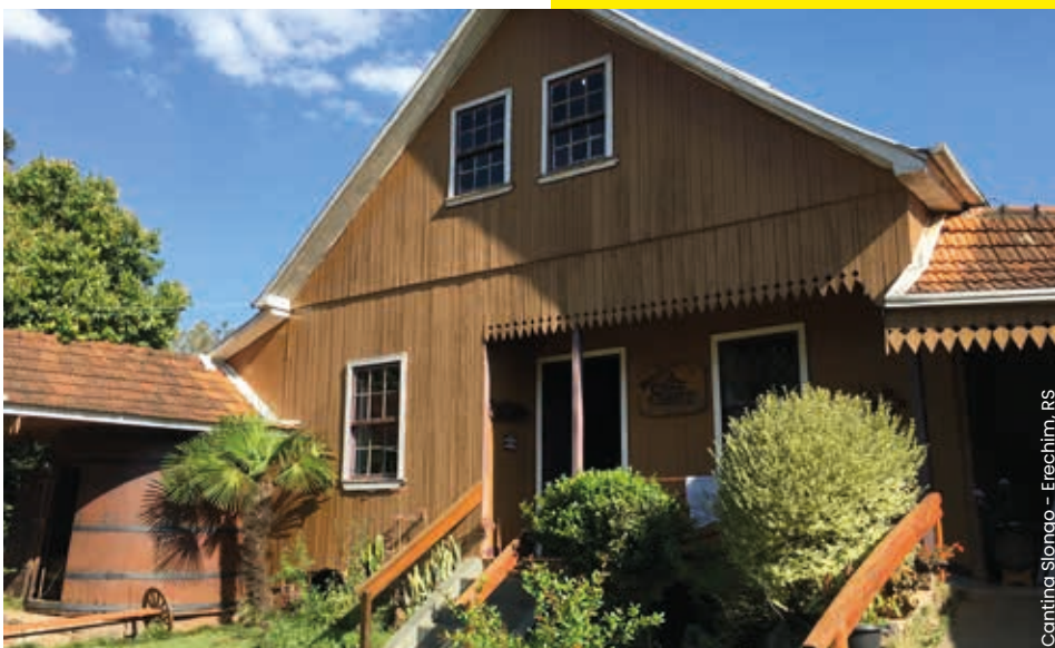
Cantina Slongo - Erechim, RS

O lema “Ordem e Progresso” encontra-se escrito na Bandeira do Brasil.