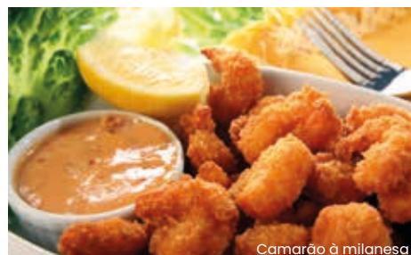
Camarão à milanesa