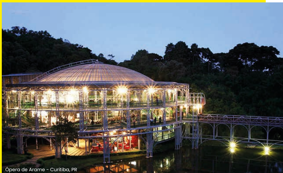
Ópera de Arame - Curitiba, PR