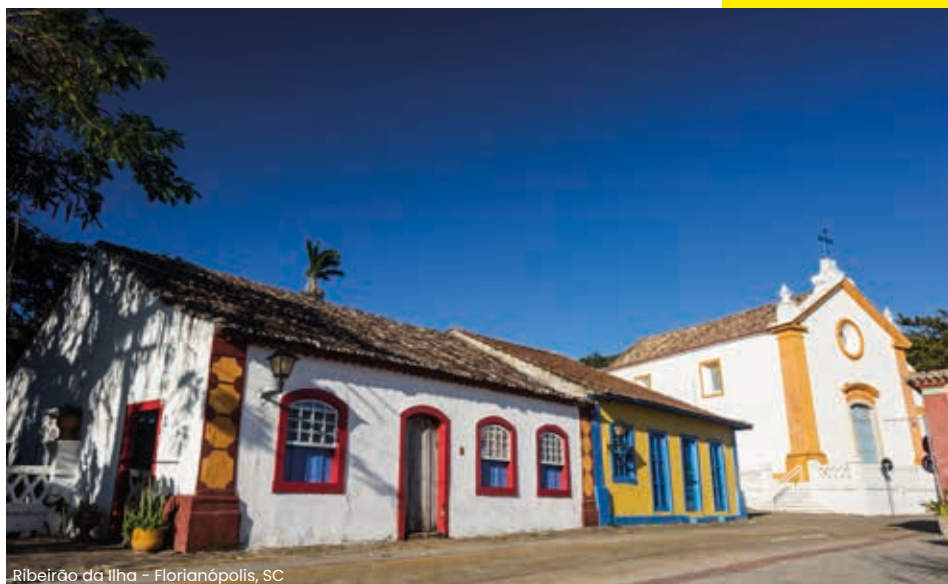
Ribeirão da Ilha – Florianópolis, SC