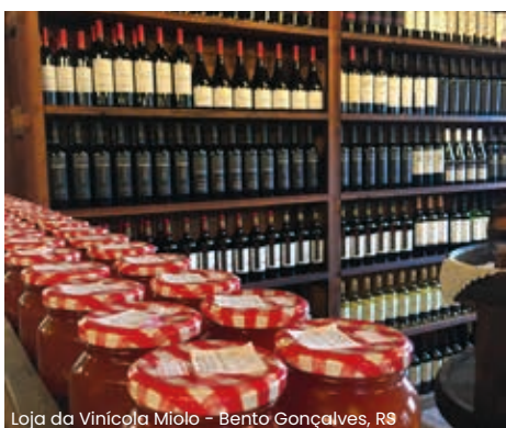
Loja da Vinícola Miolo - Bento Gonçalves, RS