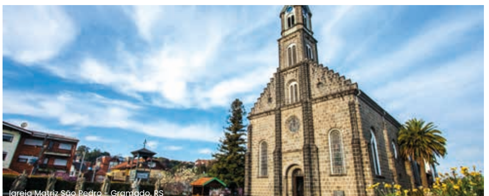
Igreja Matriz São Pedro - Gramado, RS