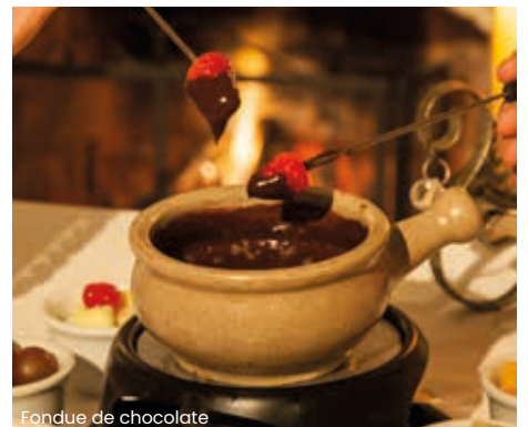
Fondue de chocolate