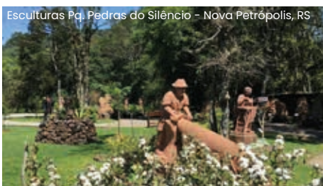
Esculturas Pa. Pedras do Silêncio - Nova Petrópolis, RS

Café da manhã. Às 8h00, saída para a cidade de Nova Petrópolis com colonização alemã, a fim de visitar o Esculturas Parque do Silêncio (Ingresso Incluído).