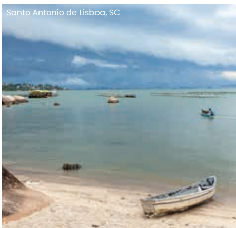
Santo Antonio de Lisboa, SC