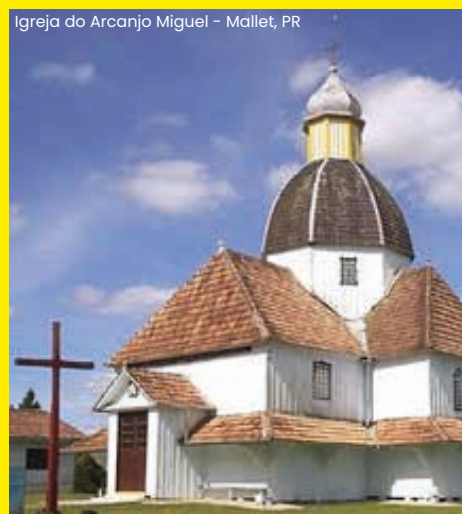
Igreja do Arcanjo Miguel – Mallet, PR

A cidade de Mallet é rica na cultura eslava, mantendo a língua, costumes e religiosidade de seus antepassados.