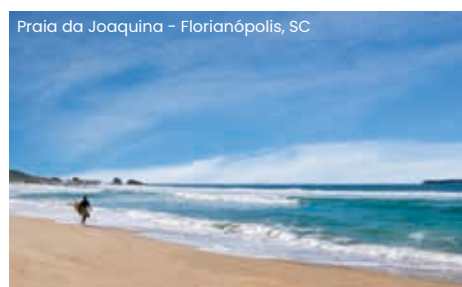
Praia da Joaquina – Florianópolis, SC