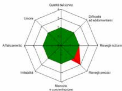
MAPPA DELLA PERCEZIONE COMPLESSIVA DELLA QUALITÀ DEL SONNO