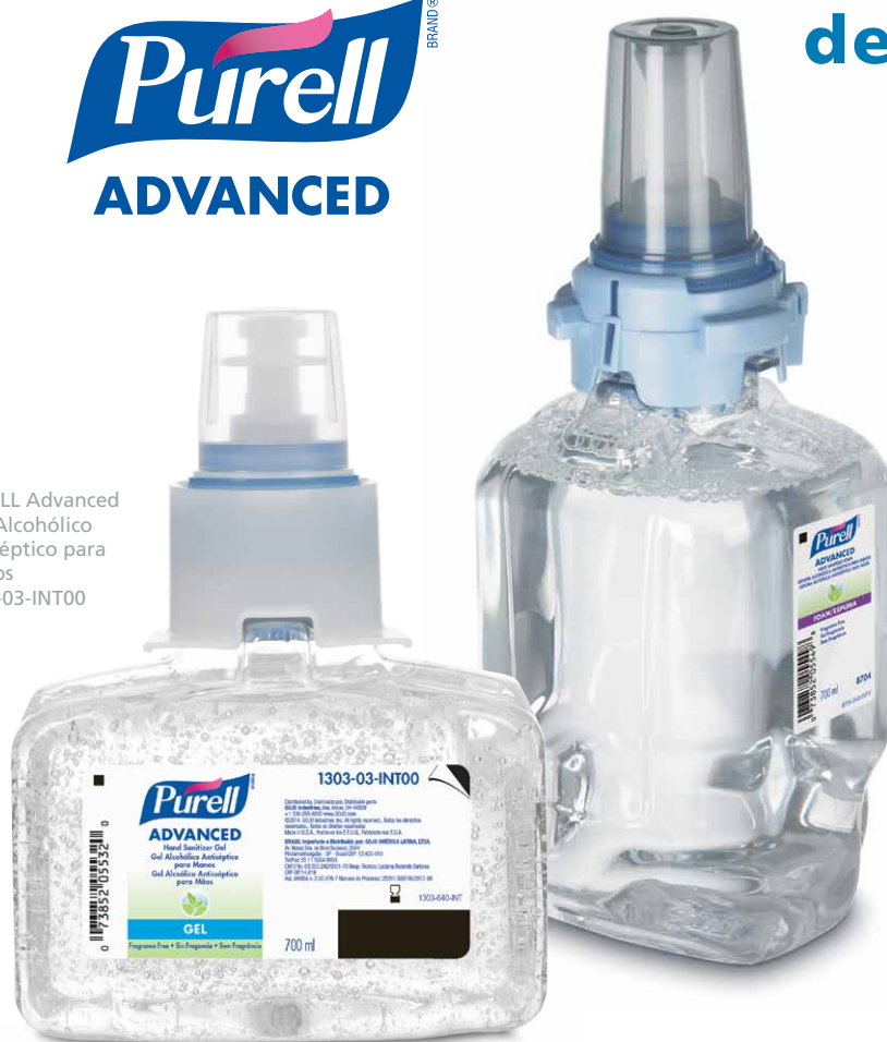
PURELL Advanced Espuma Alcohólica Antiséptica para Manos 8704-04-INT00

Clínicamente comprobado para mantener una piel saludable – suave e hidratada. 2