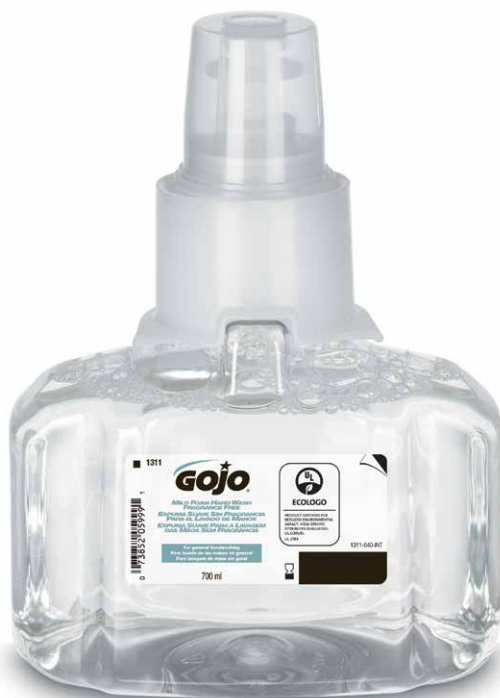
GOJO Espuma suave sin fragancia para el lavado de manos 1311-03-INT00