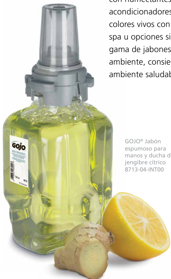
GOJO® Jabón espumoso para manos y ducha de jengibre cítrico 8713-04-INT00

Estos nuevos sistemas ofrecen una gama de formulaciones en espuma, enriquecidas con humectantes, extractos naturales y acondicionadores para la piel. Ya sea que prefiera colores vivos con fragancias agradables tipo spa u opciones sin fragancia ni color, nuestra gama de jabones certificados en el cuidado del ambiente, consienten al usuario y promueven un ambiente saludable.