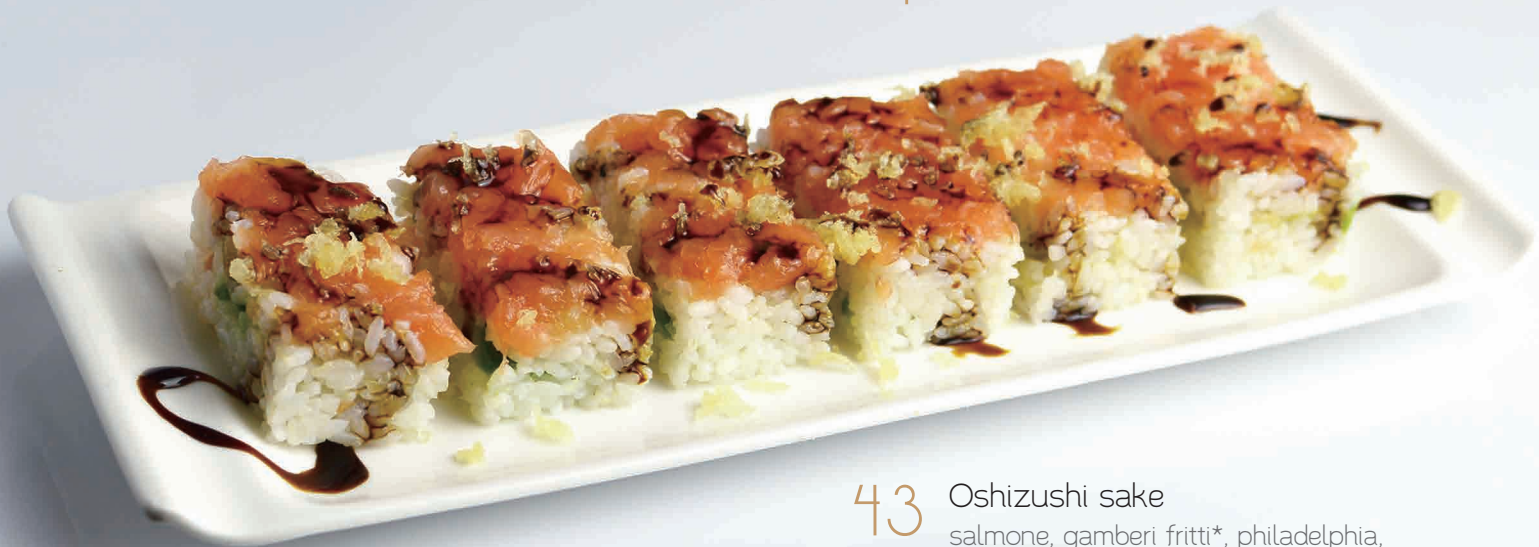
43 Oshizushi sake salmone, gamberi fritti*, philadelphia, avocado, avvolto da salmone, focchi di tempura, salsa teriyaki (2,4,7) € 6,00