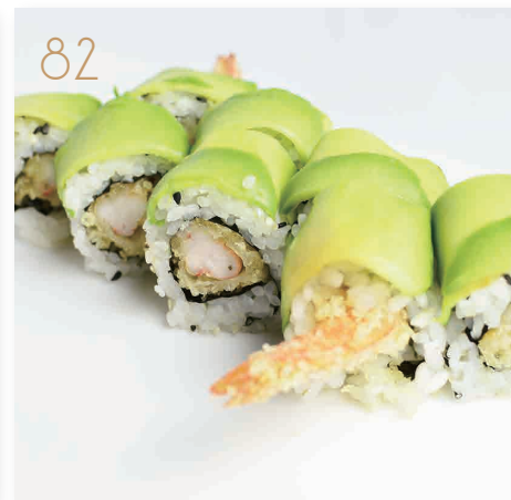
82 Dragon roll gamberi fritti*, maionese, avvolto da avocado, salsa teriyaki (1,2,3,6,11) € 9,00