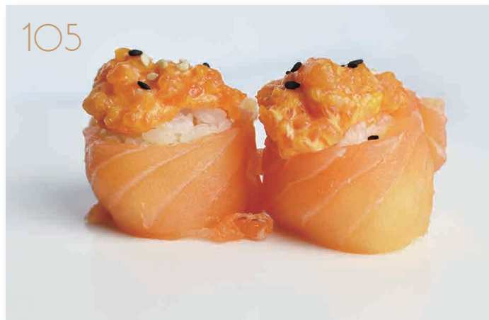
Spicy salmon salmone, maionese piccante con salmone esterno (3,4,11) (1 volta a persona) € 5,00