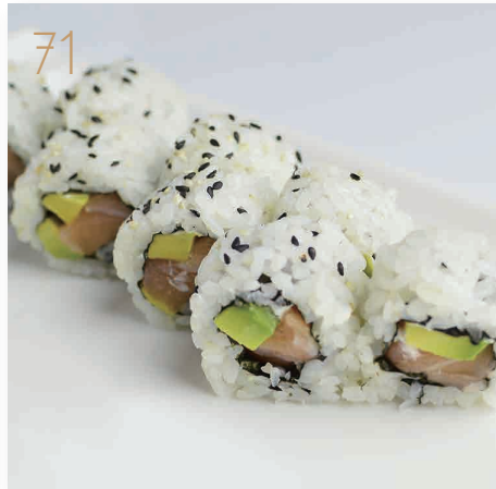
71 Sake philadelphia salmone, avocado, philadelphia, sesamo (4,7,11) € 7,00