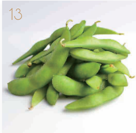
Edamame* fagioli di soia bolliti (6) € 5,00