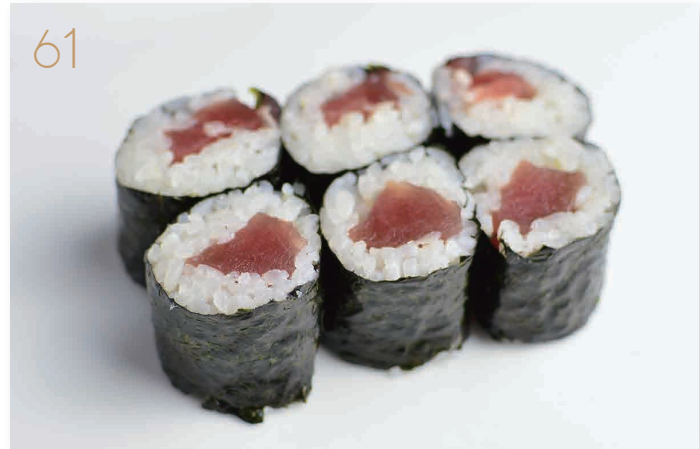
Hoso maguro tonno (4) € 6,00