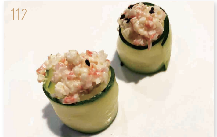
112 California zucchine surimi di granchio*, maionese con zucchine all'esterno (2,3,11) € 8,00