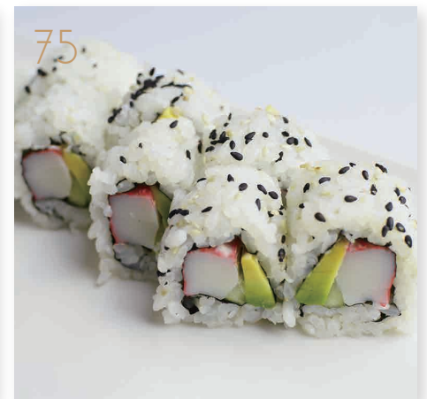
75 California granchio*, certrioli, avocado, maionese, sesamo (1,2,3,11) € 7,00