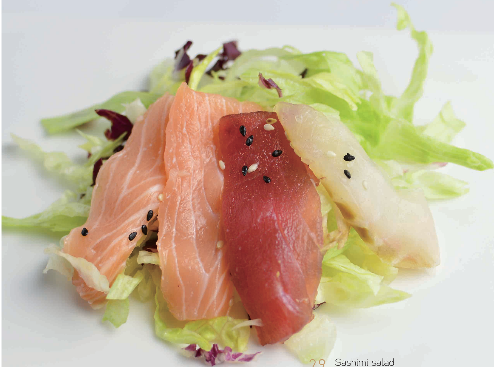
29 Sashimi salad insalata con pesce misto, salsa sesamo (2,3,4,6,11) € 6,00