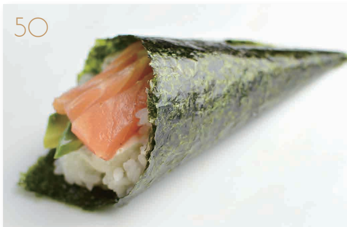
Temaki sake salmone, avocado, philadelphia (3,4,11) € 4,00