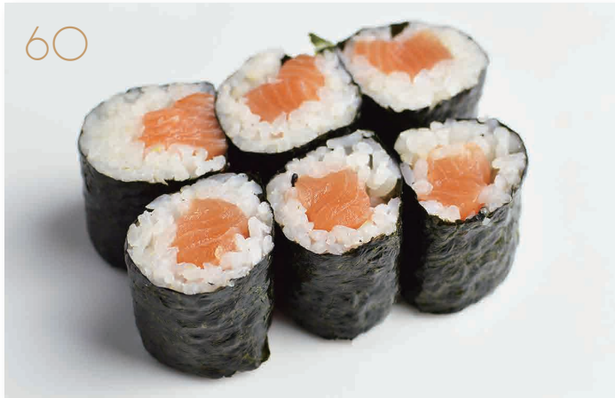
Hoso sake salmone (4) € 5,00