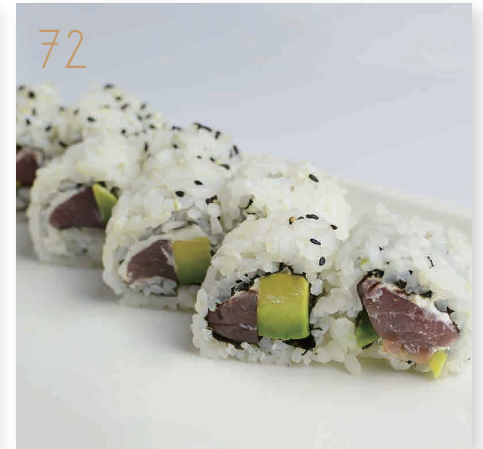
72 Tonno philadelphia tonno, avocado, philadelphia, sesamo (4,7,11) € 8,00