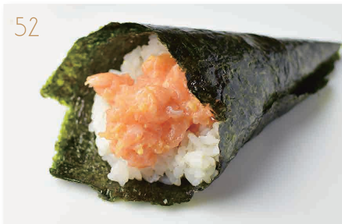
Spicy salmon salmone, maionese, piccante (3,4) € 4,00