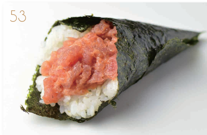
Spicy tonno tonno, maionese, piccante (3,4) € 5,00