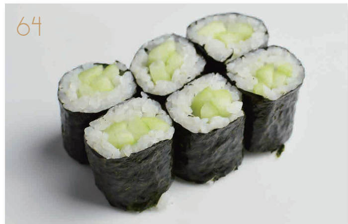
Hoso kappa cetriolo (2) € 5,00