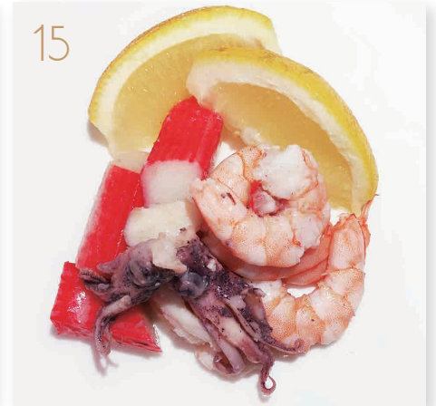
Insalata misto di mare Polipo*, gamberi*, calamari*, surimi* e rucola (2,14) € 8,00