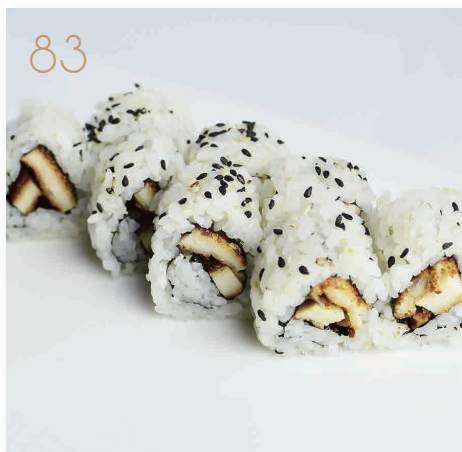
83 Chicken roll pollo fritto, maionese, sesamo, salsa teriyaki (1,3,6,11) € 7,00