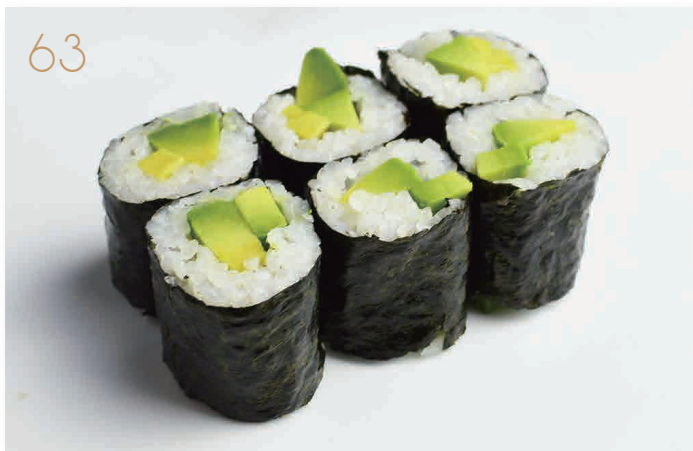
Hoso avocado avocado € 5,00