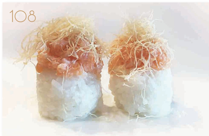
Sake ball (senza alga) bocconcini di riso con tartare salmone, philadelphia, tobiko* e pasta kataifi (3,4,7) (1 volta a persona) € 4,00