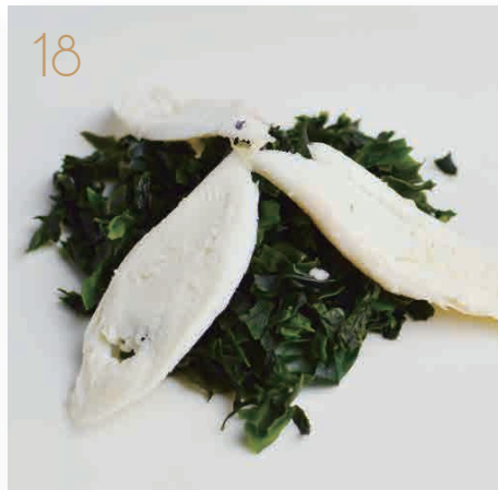
Alghe tako Alghe nera con polipo* e salsa ponzu (14) € 6,00