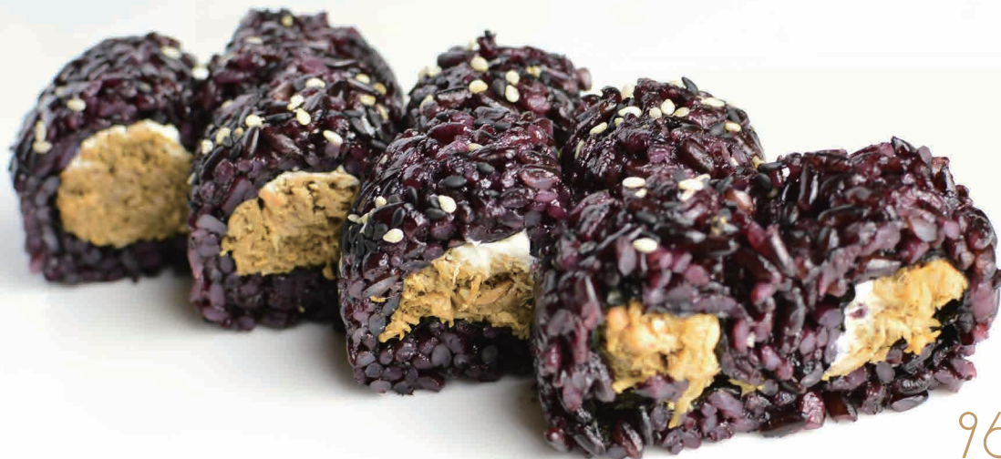
96 Black miura Riso venere, salmone cotto, philadelphia (4,6,7) € 8,00