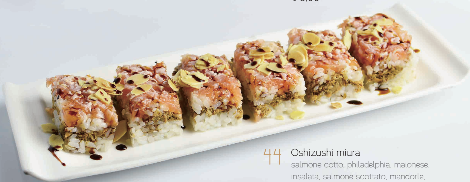
44 Oshizushi miura salmone cotto, philadelphia, maionese, insalata, salmone scottato, mandorle, salsa teriyaki (3,4,7) € 6,00