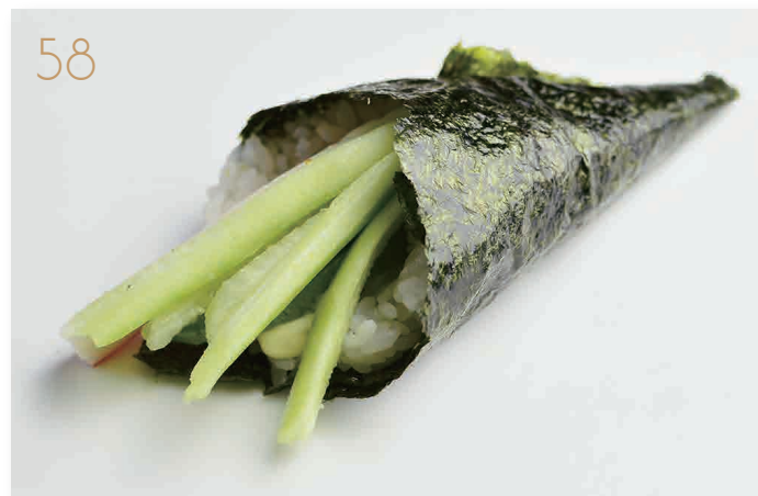
Vegetariano insalata, cetriolo, avocado, maionese (3) € 4,00