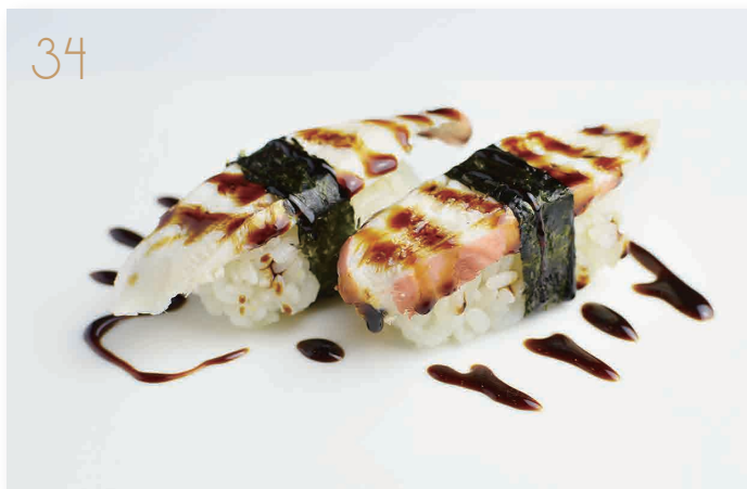
Nigiri di polipo* con salsa teriyaki (14) € 4,00