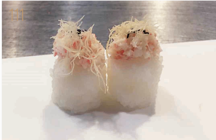
111 Surimi ball (senza alga) bocconcini di riso con tartare di surimi, sesamo e pasta kataifi (2,11) € 5,00