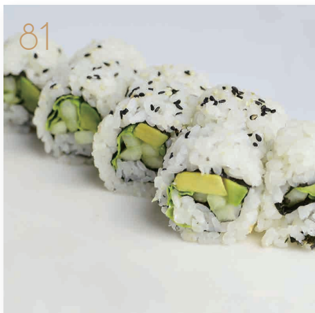
81 Vegetariano insalata, cetriolo, avocado, maionese, sesamo (3,11) € 7,00