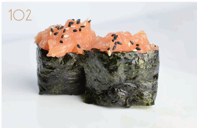
Salmon salmone, maionese piccante (3,4,11) € 4,00