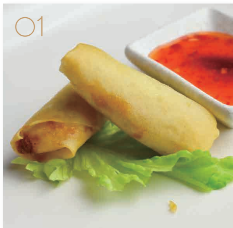
Harumaki spring roll 2pz involtini di primavera (1,3,7) € 3,00