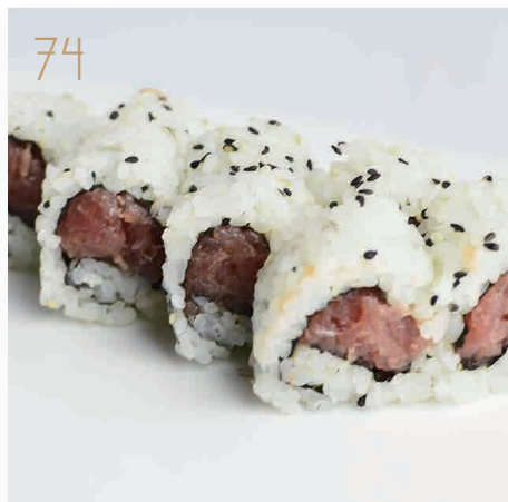
74 Spicy tonno salmone, maionese, piccante, sesamo (3,4,11) € 8,00