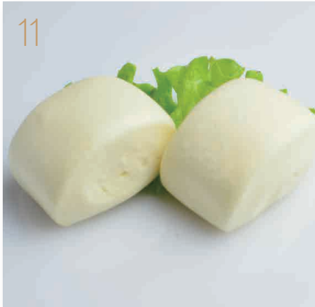
Pane giapponese* 2pz (1,7) € 3,00