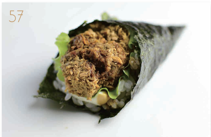
Miura salmone cotto, philadelphia, salsa teriyaki (1,4,6,7) € 4,00