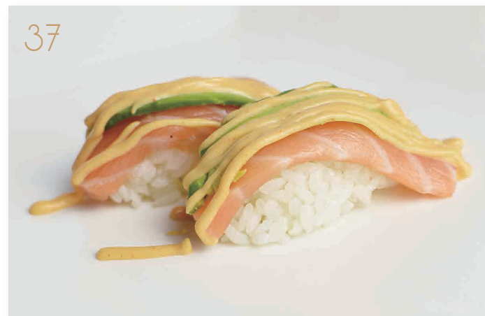
Sake avocado con salsa maionese piccante (3,4) € 4,00