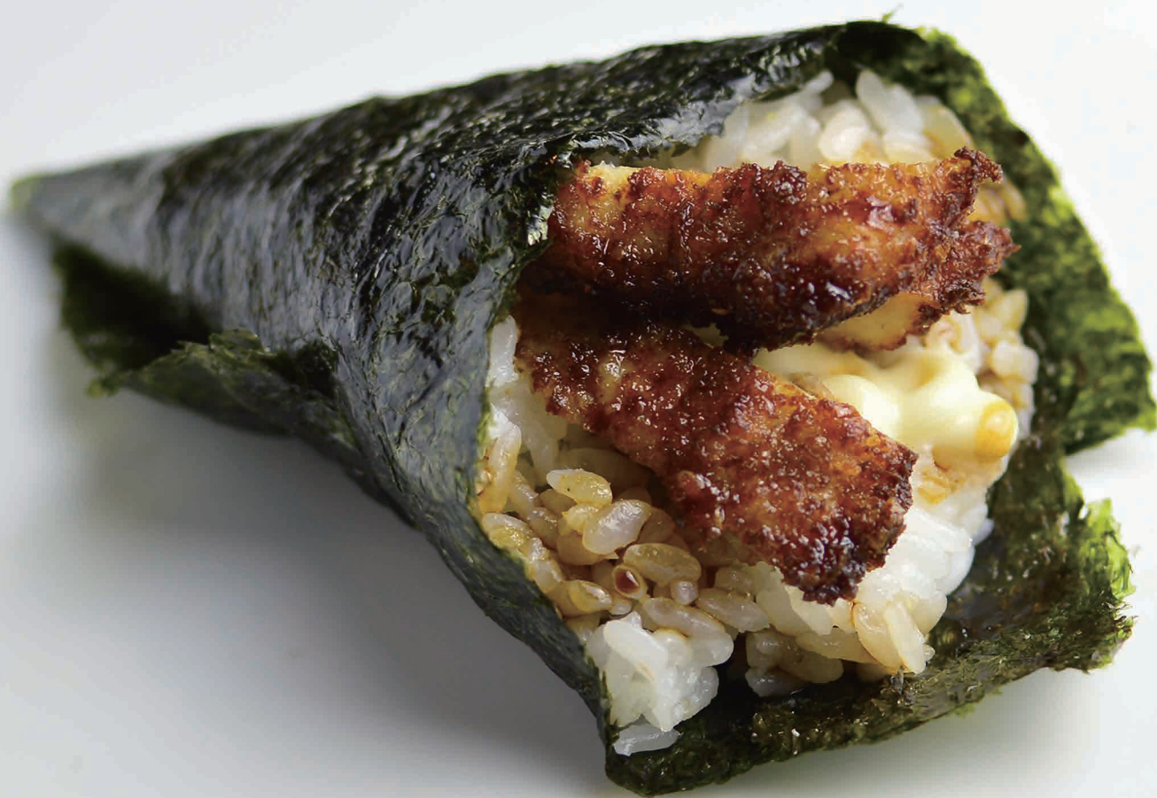
59 Temaki chicken pollo fritto, maionese, salsa teriyaki (1,3,6) € 5,00