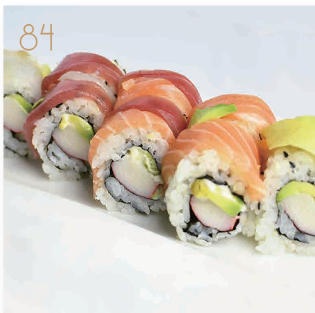
84 Rainbow roll al base di California avvolto da pesce misto e avocado (1,2,3,4) € 9,00