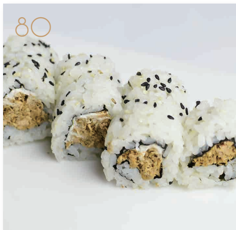
80 Miura salmone cotto, philadelphia, sesamo, salsa teriyaki (4,6,7,11) € 7,00