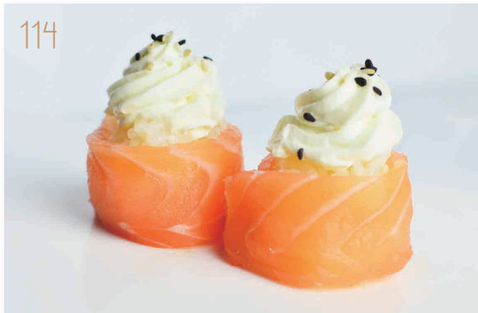
114 Sake philadelphia philadelphia con salmone esterno e sesamo (4,7,11) (1 volta a persona) € 5,00