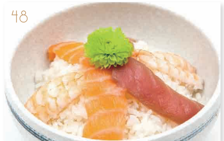
Chirashi mix pesce misto, gambero cotto*, riso, sesamo (2,4,11) € 6,00