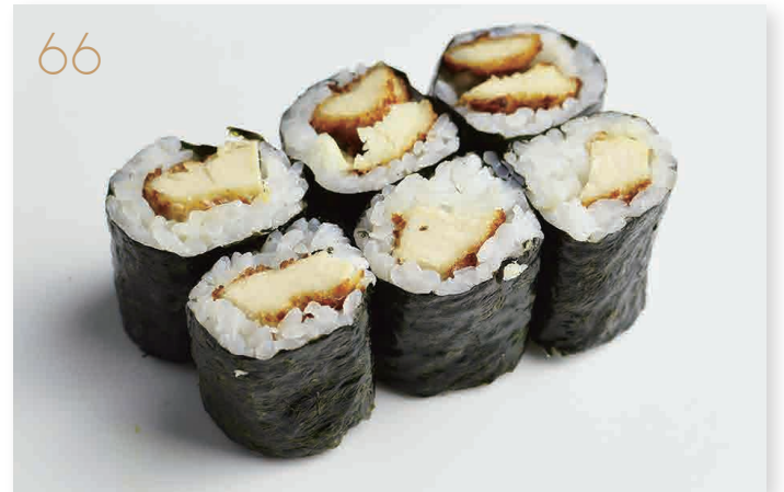
Hoso chicken pollo fritto, salsa teriyaki (1,3,6) € 5,00