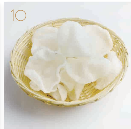
Nuvole di drago (2) € 3,00