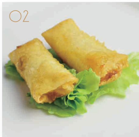
Harumaki 2pz involtini di gamberi (1,2,3,7) € 3,00