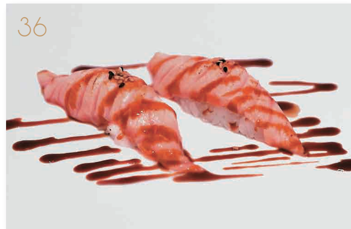
Sake flambé salmone scottato con salsa teriyaki (1,4,6) € 4,00