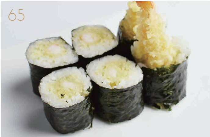
Hoso ebiten gambero fritto*, salsa teriyaki (1,2,6) € 5,00