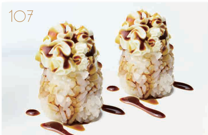
Philadelphia ball (senza alga) bocconcini di riso con philadelphia e salsa teriyaki (6,7,11) € 3,00