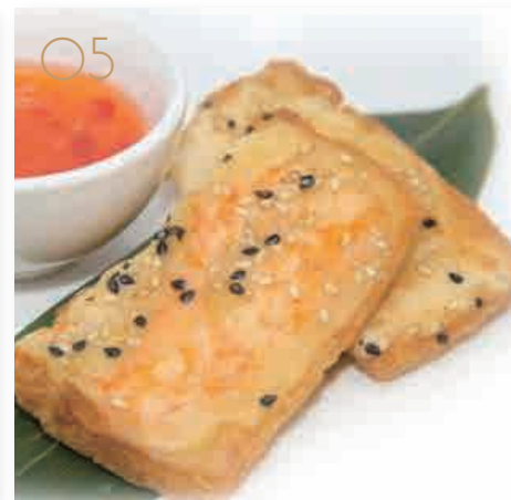
Toast di gamberi 2pz (1,3,11) € 5,00