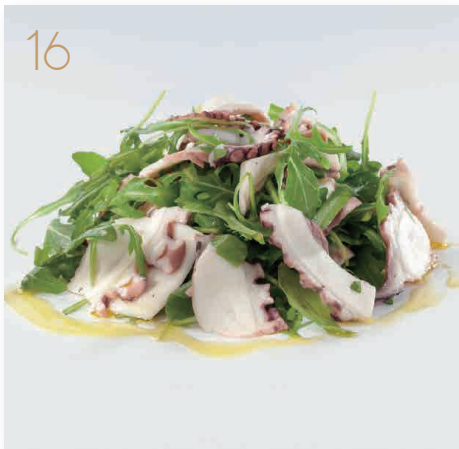
Polipo* rucola (14) € 8,00