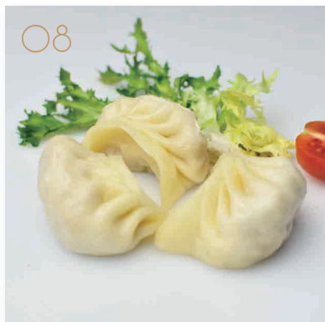
Gyoza* 3pz ravioli di carne (1,2,3,5,6,7,10,11) € 4,00