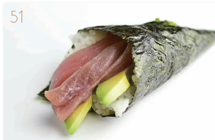
Temaki maguro tonno, avocado, philadelphia (3,4,11) € 5,00