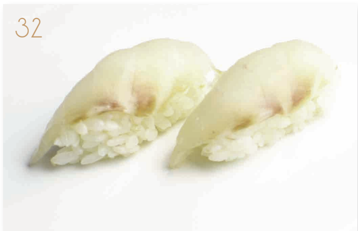
Nigiri di branzino (4) € 3,00