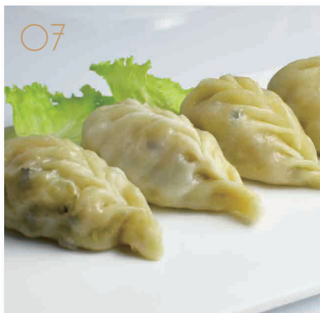
Yasai shumai* 3pz ravioli di verdure (1,6,11) € 4,00