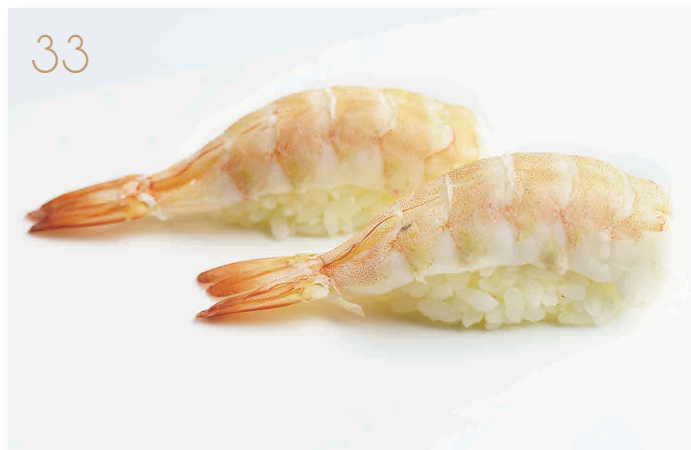
Nigiri di gambero* cotto (2) € 4,00