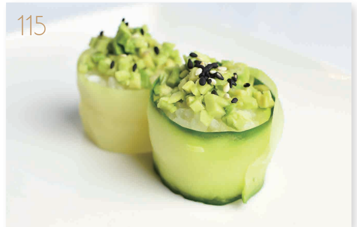
115 Vegetariano avocado con zucchine esterno e sesamo (11) € 4,00