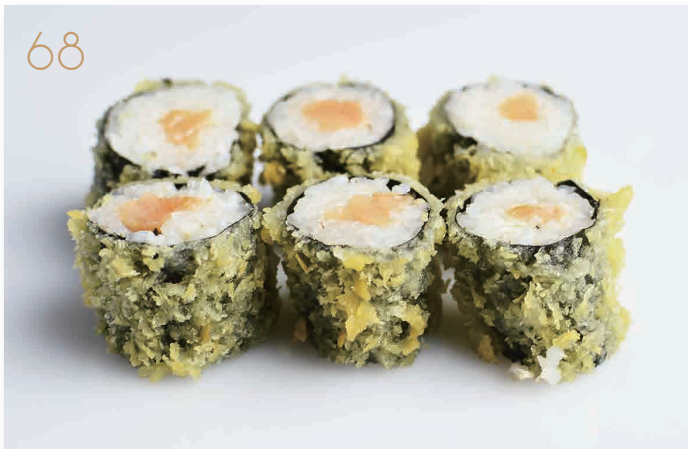
Hoso fritti salmone, philadelphia (1,4,7) € 6,00