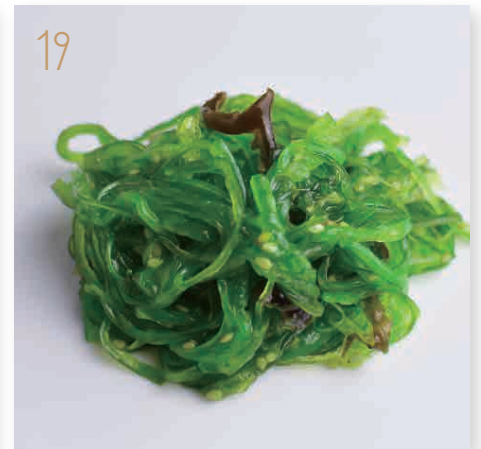
Wakame Alghe giapponese (11) € 4,00