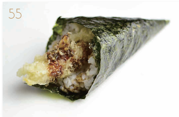
Ebiten gambero fritto*, maionese, salsa teriyaki (1,2,3,6) € 4,00