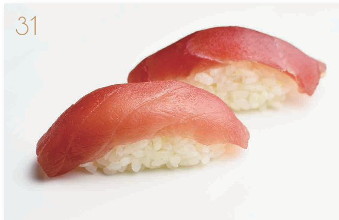
Nigiri di tonno (4) € 4,00