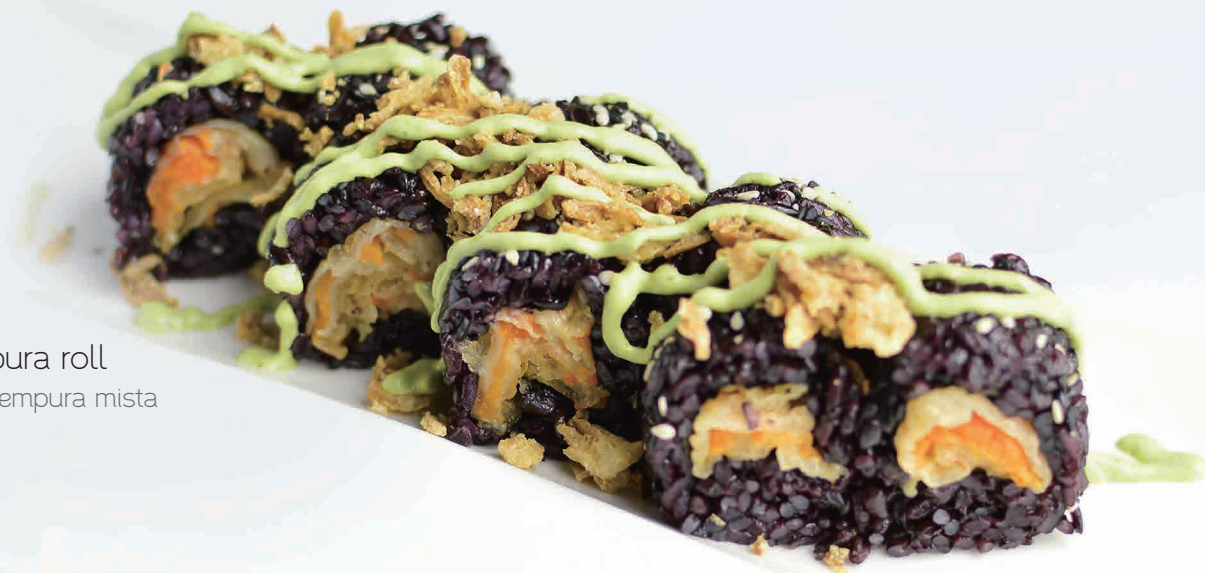
95 Black tempura roll riso venere, tempura mista (1,2,3,4,11) € 10,00