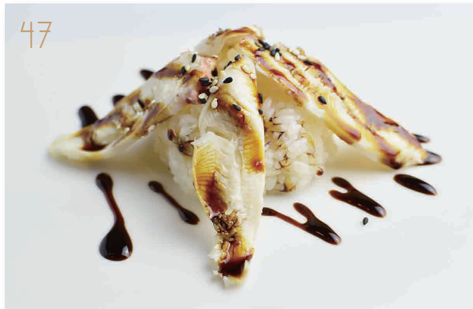
Tako don polipo*, riso, teriyaki, sesamo (1,6,11,14) € 6,00