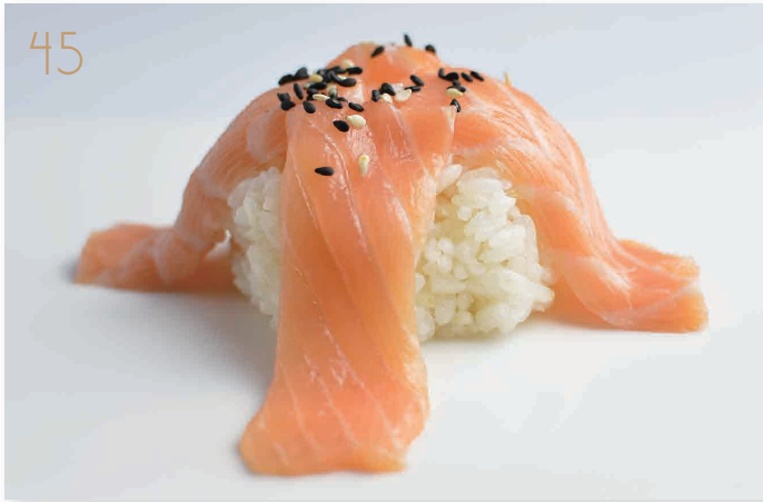
Sake don salmone, riso, sesamo (4,11) € 5,00