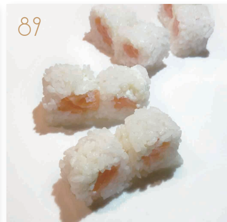
89 Sake fresh roll (senza alga) salmone, philadelphia (4,7) € 7,00