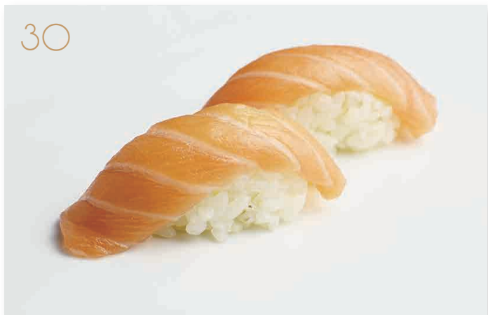
Nigiri di salmone (4) € 3,00