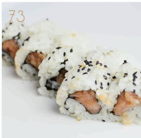
73 Spicy salmon salmone, maionese, piccante, sesamo (3,4,11) € 7,00