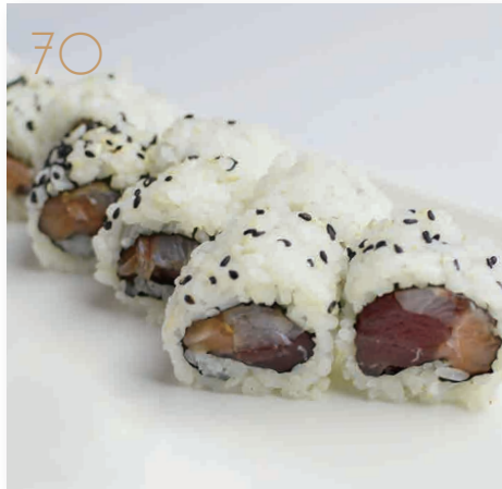
70 Uramaki misto salmone, branzino, tonno (4,11) € 8,00