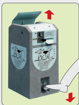
Sistema di apertura del cestello

Disponibile con gettoniera predisposta per monete da: € 0,10 / € 0,20 / € 0,50 o ad erogazione gratuita