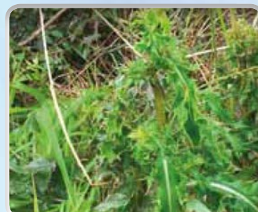
Distel vóór behandeling