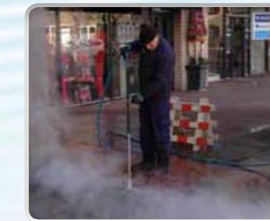
Kauwgum verwijderen: 4 tot 5 keer sneller