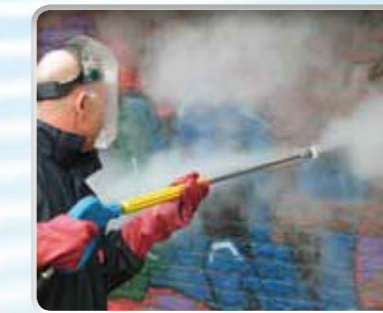
Graffiti verwijderen: zonder reinigings-/afbijtmiddelen