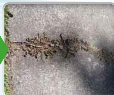
Onkruid op trottoir 2 dagen na behandeling