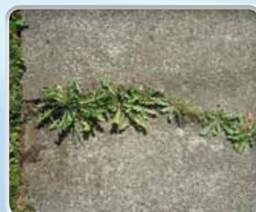
Onkruid op trottoir

Omdat het waterverbruik per persoon tot slechts 5 a 6 ltr. per minuut is te reduceren wordt met de watertank van 1200 ltr. een werktijd tot 4 uur verkregen. Met de oppervlaktewater-intake module (pomp / filter / zuigslang) is de watertank overal en op een uiterst eenvoudige manier bij te vullen.