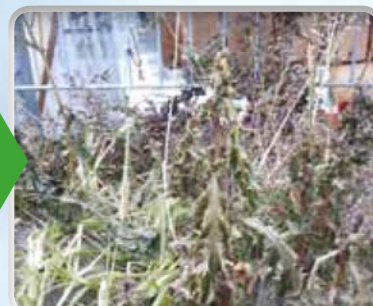
Distel 2 dagen na behandeling