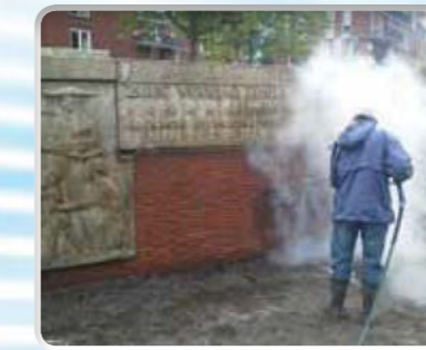
Gevelreinen: zonder chemie en zonder beschadigen