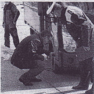
I rilievi dei vigili sul furgone

Per il conducente del furgone (difesa Guido Beghini) l'accusa fu duplice (omicidio colposo e lesioni colpose gravissime), i parenti della coppia sono assistiti dagli avvocati Ste-