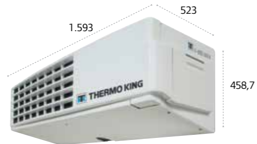
V-800/V-800 MAX/V-800 MAX Spectrum