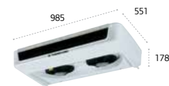
ES300/ES300 MAX ultraplano