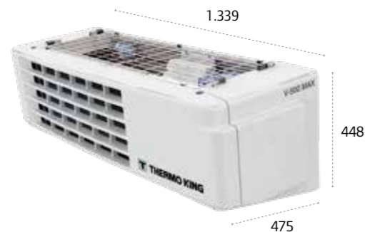
V-500/V-500 MAX/ V-600 MAX/V-500 MAX Spectrum