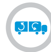
Rango del punto de consigna ajustable para cada compartimento