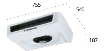
ES150 MAX ultraplano