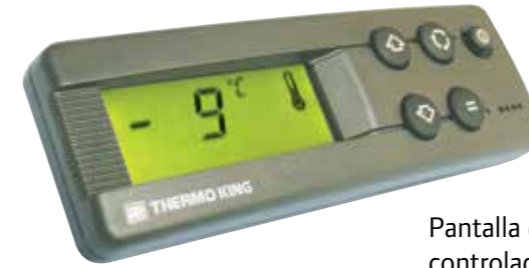
Pantalla en cabina del controlador DSR