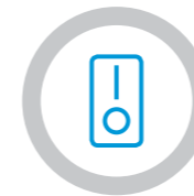
Encendido/apagado de cada compartimento