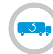
Monotemperatura, en caso necesario