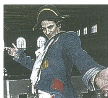
Stenterello, la maschera fiorentina del Carnevale creata nel XVIII secolo

Il Carnevale di Firenze proseguirà sabato con un pomeriggio di musica, sfilate, giocolieri e mangiafuoco che incanteranno grandi e piccini: la parata, realizzata con il contributo della Camera di Commercio di Firenze,