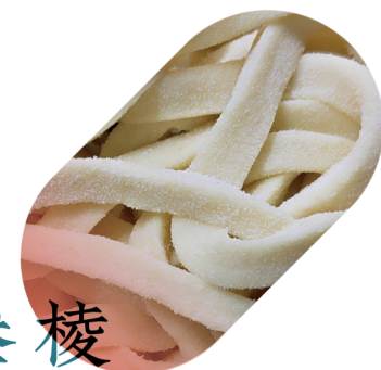
叁棱 TRIANGOLO 6 TIRATE