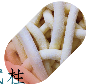
贰柱 5 TIRATE