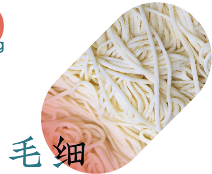
毛细 8 TIRATE