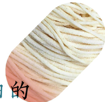
细的 7 TIRATE