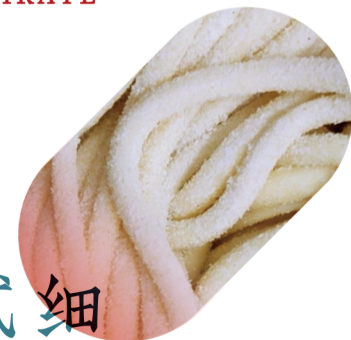
贰细 6 TIRATE