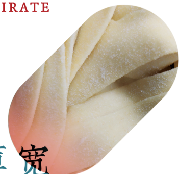
薄宽 TAGLIATELLE 5 TIRATE

A RICHESTÀ ANCHE UNA VERSIONE VEGETARIANA / WE ALSO HAVE VEGETARIAN SOUP NOODLES / 提供完全素食主义的素面