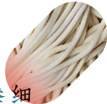
叁细 6½ TIRATE