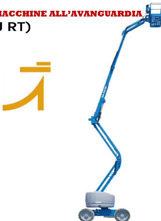
DIAGRAMMA DI LAVORO Z m -51/30J RT