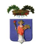
PROVINCIA DI ENNA