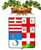
PROVINCIA DI CUNEO