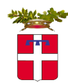
PROVINCIA DI TORINO