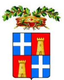
PROVINCIA DI SASSARI