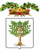
PROVINCIA DI ORISTANO