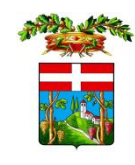
PROVINCIA DI ASTI