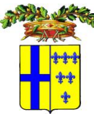
PROVINCIA DI PARMA