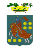
PROVINCIA DI PRATO