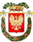
PROVINCIA DI NOVARA