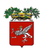
PROVINCIA DI PERUGIA