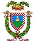
PROVINCIA DI PISTOIA