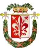
PROVINCIA DI FIRENZE