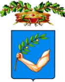
PROVINCIA DI ANCONA