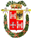
PROVINCIA DI ASCOLI PICENO