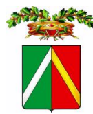
PROVINCIA DI LODI