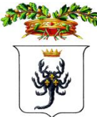
PROVINCIA DI TARANTO