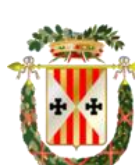
PROVINCIA DI CATANZARO