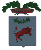
PROVINCIA DI BENEVENTO