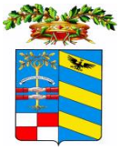
PROVINCIA DI URBINO