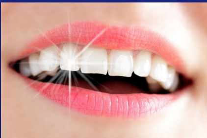
Weißer Zähne mit Bleaching (Zahnaufhellung)