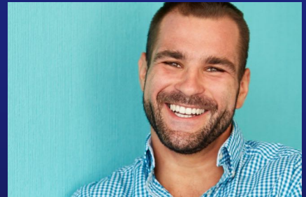
Unsichtbare Zahnfüllungen aus Komposit & Keramik