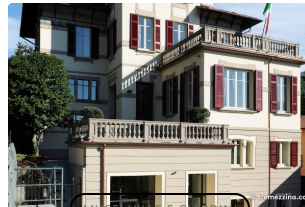
Casa Brenna Tosatto