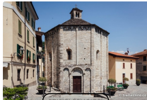
Battistero di San Giovanni Battista