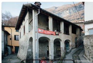
Casa dei Presepi Mezzegra (Tremezzina)

Scopri le principali attrazioni lungo il percorso o nei dintorni