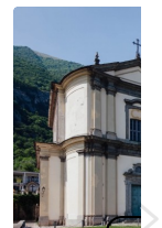
Chiesa di Sant'Abbondio Mezzegra (Tremezzina)