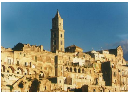
Sasso "Barisano" - Matera