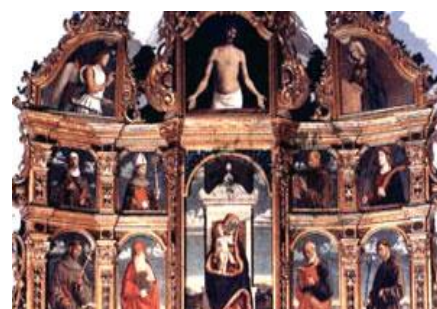
Polittico di Cima da Conegliano - Miglionico