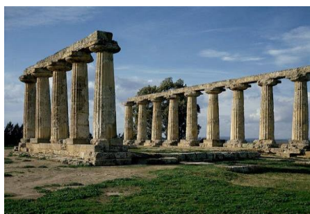
Tavole Palatine – Metaponto