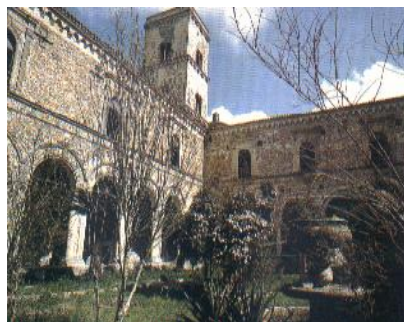
Abbazia di S. Michele - Montescaglioso