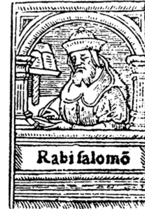
Rashi, fransk trykk fra 1539.

Den spansk-jødiske oppdagelsesreisende, Benjamin av Tudela, reiste på midten av 1100-tallet på en ferd som brakte ham fra Spania helt til India. På turen dro han også gjennom Sør-Frankrike. Her forteller han om et særlig høyt nivå av Torah-studier. Fra andre kilder vet vi at jødisk mystisisme ble studert i regionen. Her faller det naturlig å trekke frem boka Sefer bahir , et verk forfattet sent på 1100-tallet