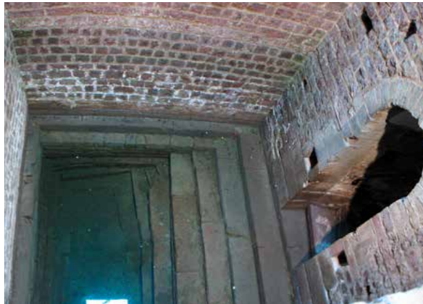
Mikven i Speyer ble konstruert i 1128.

Englands første jøder kom til landet sammen med Wilhelm erobreren og normannerne etter 1066 og etablerte seg etter hvert i 28 engelske byer. Det første engelsk-jødiske samfunnet eksisterte bare i 200