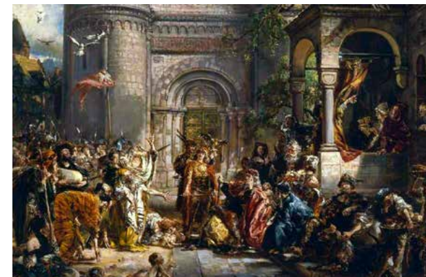
Mottakelsen av jødene i Polen. Oljemaleri av Jan Matejko, 1889.

Da vikingferdene tok slutt på midten av 1000-tallet, kunne imidlertid handel gjenopptas. Da var det også et behov for den kompetansen og de handelsnettverkene jødene besatte.