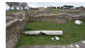
Synagogeruin i Ostia

Det italienske-jødiske samfunnet produserte også en rekke diktere og lærde. Her vil jeg trekke frem Immanuel Romano (1261-1328) – tenker og poet. Immanuel snakket italiensk, hebraisk, arabisk og latin. Han interesserte seg for matematikk, astronomi, legevitsenskap og teologi. Men det var som poet han virkelig blomstret. Immanuel var den første som skrev sonetter på hebraisk. I hans samling med hebraiske dikt, Mehaberot , finnes et visjonsdikt kalt Ha-Tofet ve-ha-Eden (Helvete og paradiset). Diktet er tilsynelatende inspirert av Dantes Gudommelige komedie . Diktets hovedperson, en eldre mann på 60 år, bekymrer seg for hvilken skjebne han vil gå i møte etter døden. For å stilne hans bekymringer kommer hans nylig avdøde venn Daniel til ham. Daniel leder den eldre mannen gjennom