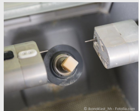
Das Inlay wird innerhalb weniger Minuten aus einem Keramik-Block gefräst.

Diese Technik spart nicht nur Zeit, sondern auch Geld: Weil kein Abdruck, kein Provisorium, kein Zahntechniker und kein zweiter Termin notwendig sind, können solche Inlays preisgünstiger angefertigt werden.