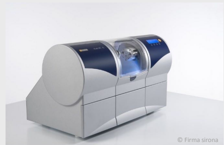
Schleifgerät für Inlays, Kronen und Brücken aus Keramik

Diese Inlays sind sehr stabil, bewährt und haltbar. Untersuchungen zeigen, dass sie so lange wie Gold-Inlays halten. Seit 1985 wurden mit dieser Methode weltweit über 20 Millionen Keramik-Inlays hergestellt und eingesetzt.