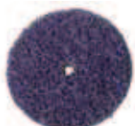
3M XT DC