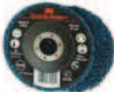
3M CG RD