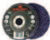
3M XT RD