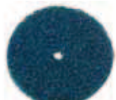
3M CG DC