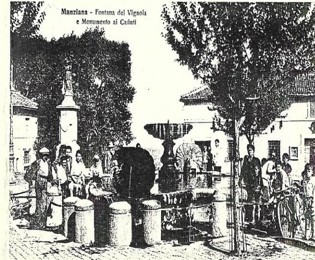
Manziana - Fontana del Vignola e Monumento ai Caduti

INTERVENTO S. E. Monsignor Romano ROSSI, Vescovo della Diocesi di Civita Castellana (Vt)