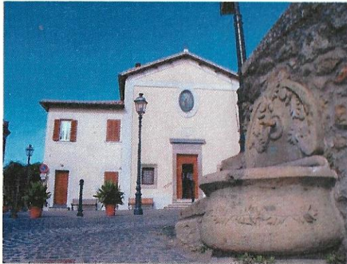
Chiesa di S. Maria del Carmine. Quadroni

COMITATO ORGANIZZATIVO Segreteria: Tel: 06 99674479 cell.3289024752 E-mail: germapi7@hotmail.com