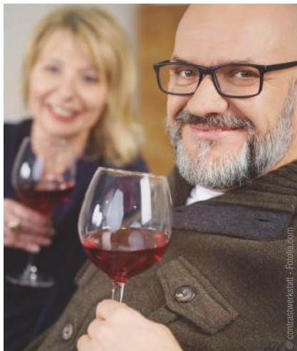
Mit fest sitzenden Zähnen kann man sich wieder jünger fühlen und das Leben aktiver genießen.

Wenn Ihnen schlecht sitzende Prothesen das Leben schwer machen: