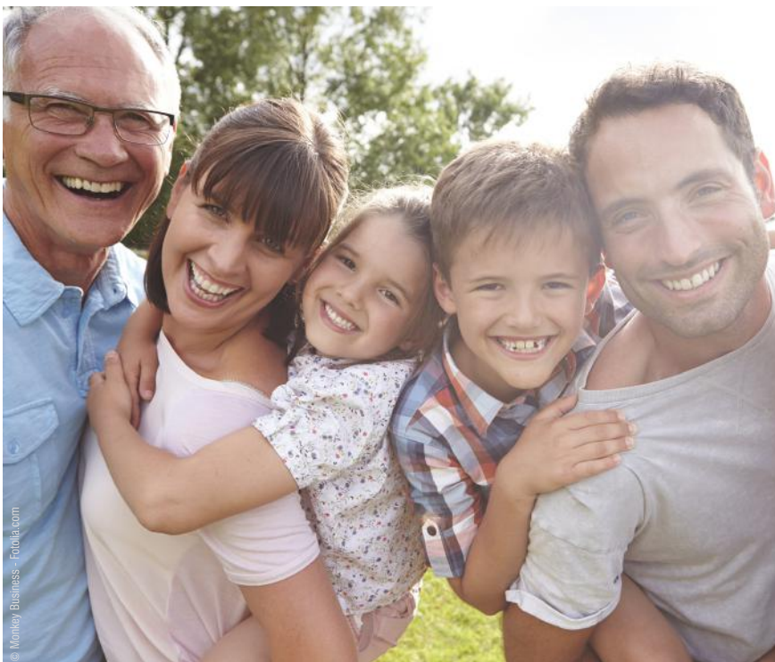
Implantate sind ab 18 Jahren bis ins hohe Alter möglich. Sie geben Sicherheit beim Reden und Lachen und sie ermöglichen es, wie mit eigenen Zähnen zu beißen und zu kauen.

Wenn die Nachbarzähne schon sehr stark gefüllt oder geschädigt sind, kann es besser sein, eine Brücke zu machen. Durch die Kronen werden die Zähne stabilisiert, so dass sie länger halten können.