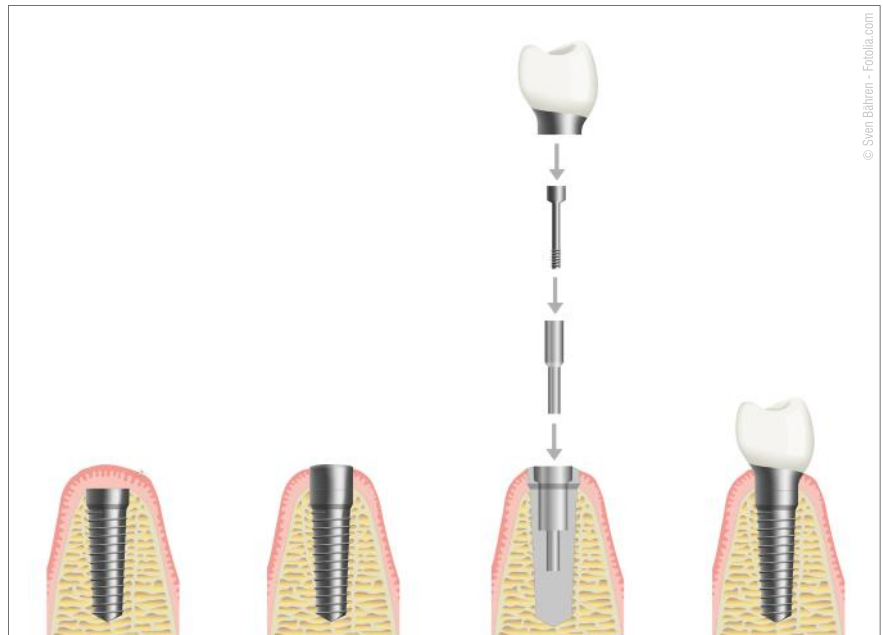
Sog. zweiphasige Implantation mit einem zweiteiligen Implantat: Das Implantat heilt unter dem Zahnfleisch ein. Nach der Einheilphase wird es freigelegt und es werden der Implantat-Aufbau und die Krone darauf befestigt.

In manchen Fällen (z.B. bei Einnahme blutverdünnender Medikamente oder bei Diabetes) muss vor der Implantation mit