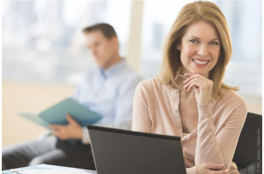
Wer heutzutage (z.B. durch einen Unfall) einen Zahn verliert, entscheidet sich meistens für ein Implantat mit Krone. Der Grund ist einfach: Kaum jemand möchte noch, dass gesunde Nachbarzähne für eine Brücke abgeschliffen werden.

Mit einer Zahnlücke kann man auch nicht mehr so gut kauen und abbeißen. Der Kieferknochen baut sich im Bereich der Lücke ab und es entsteht eine Mulde. Einzelne Zähne können beginnen zu wandern: Die Nachbarzähne kippen in die Lücke. Der gegenüberliegende Zahn verlängert sich.