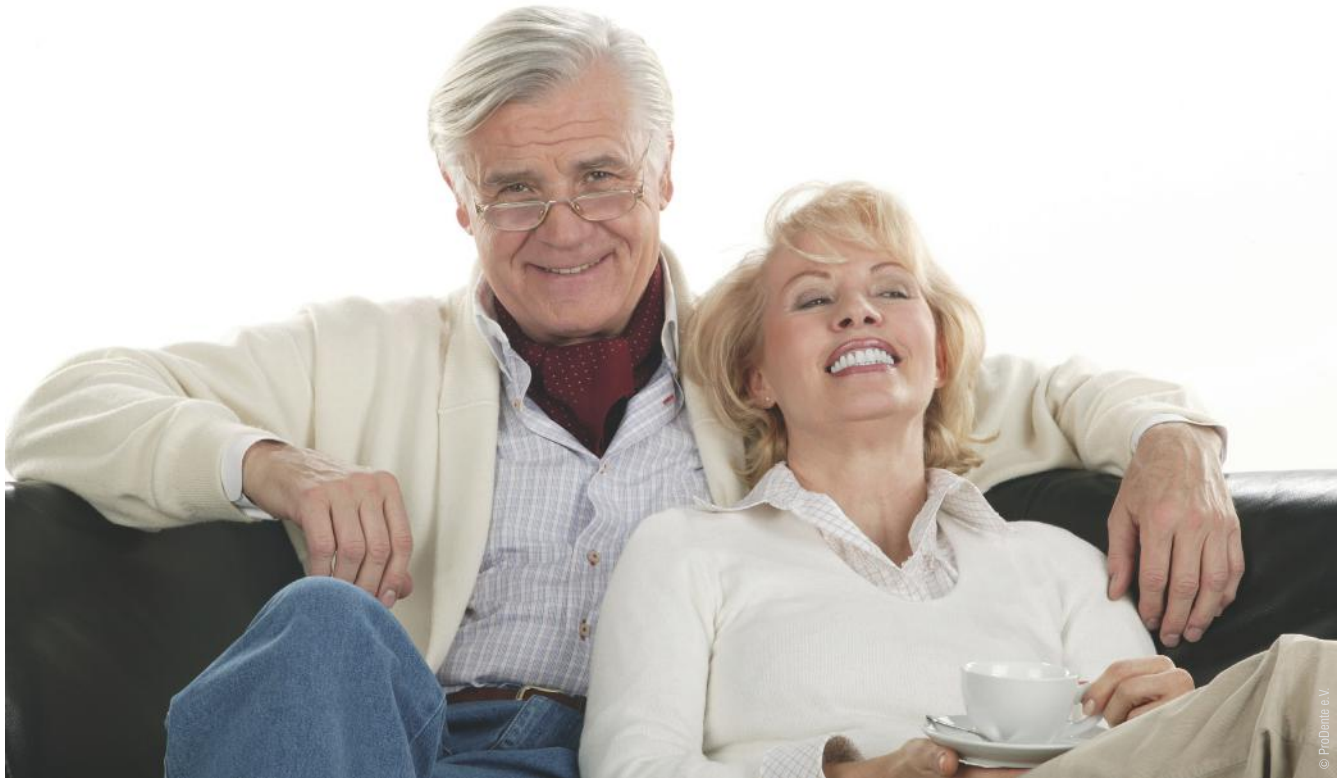
Ganz entspannt: Sicheres und gutes Gefühl mit festen Zähnen statt herausnehmbarem Zahnersatz.

Wie Sie wieder komplett fest sitzende Zähne statt Totalprothesen haben können