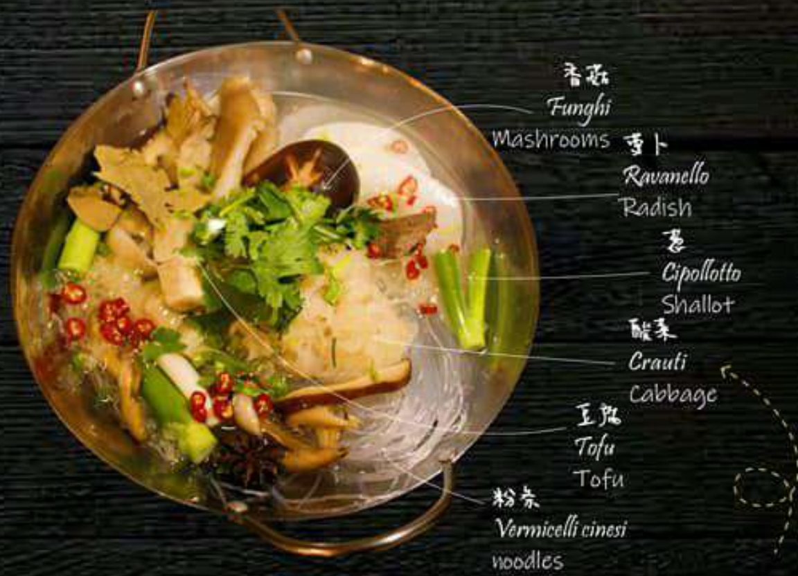
酸菜粉絲煲 12 € Crauti , vermicelli cinesi e tofu con zuppa homemade Cabbage, noodles and tofu homemade soup (sour)