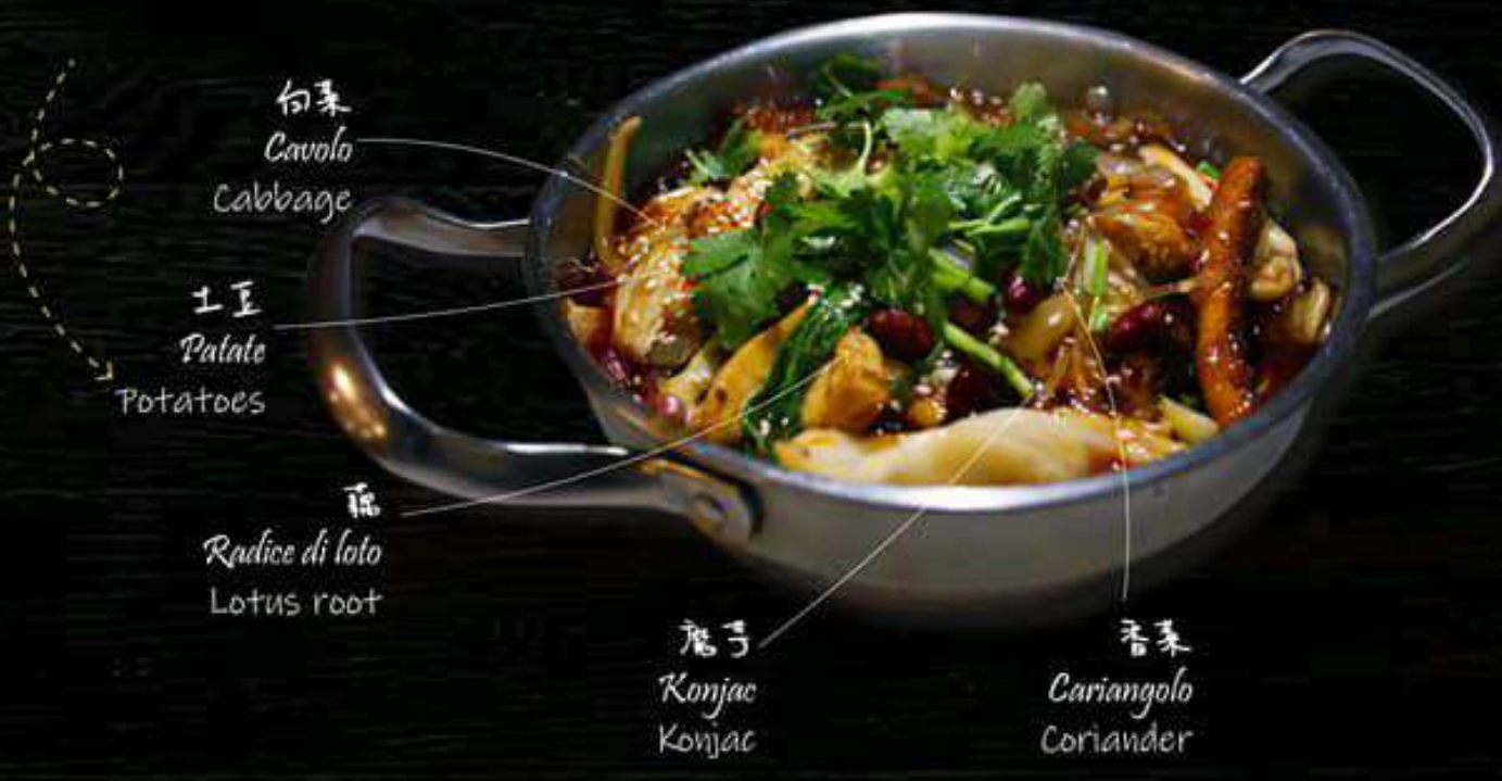
麻辣香鍋 9 € Hotpot piccante con misto verdure (verdure verde, cavolo, radice di loto, patate, konjac) Spicy hotpot with vegetables mix (green vegetable, cabbage, lotus root, potatoes, konjac)