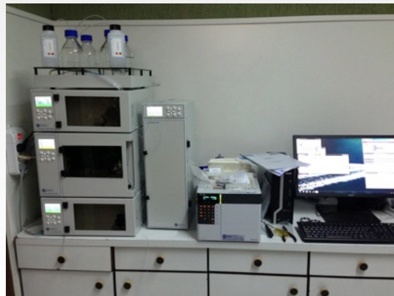
Sistema HPLC Gradiente Quaternario