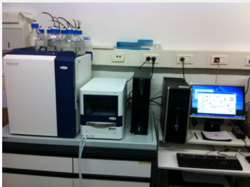
Analizzatore Automatico di Amminoacidi