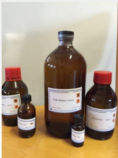
HPLC Kit Diagnostici