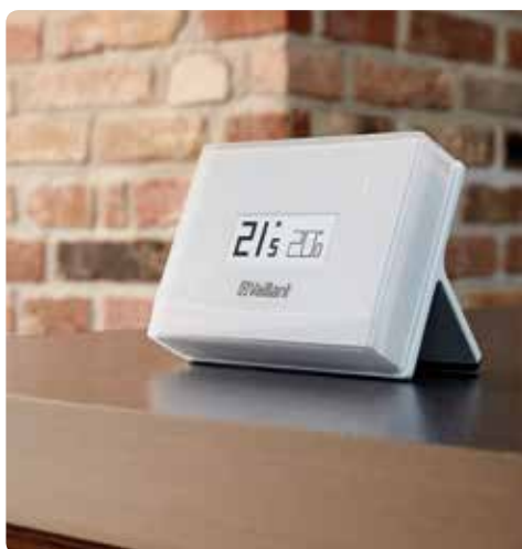
vSMART non installata a parete

vSMART trasforma il tuo smartphone o tablet in un sistema di controllo a distanza per il tuo riscaldamento. Ovunque tu sia e qualsiasi cosa tu stia facendo potrai controllare e regolare il comfort di casa in modo rapido ed estremamente intuitivo sfruttando la tua rete WiFi.