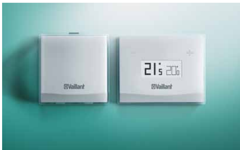
vSMART installata a parete e il suo dispositivo WiFi