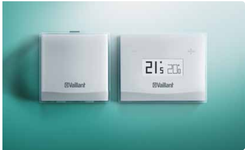
vSMART installata a parete e il suo dispositivo WiFi