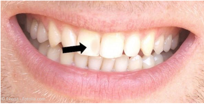
Vorher: Einfache Kunststoff-Füllung an einem Schneidezahn, die als dunkler Fleck sichtbar ist.