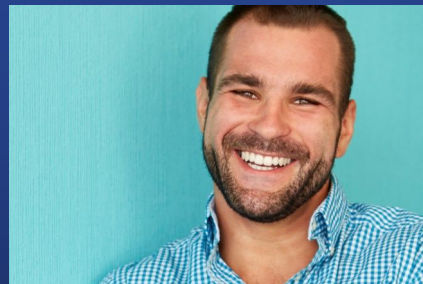
Unsichtbare Zahnfüllungen aus Komposit & Keramik

Zahnarztpraxis Jens Heukelbach • Hemhofen