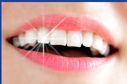
Weiße Zähne mit Bleaching (Zahnaufhellung)