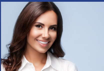
Veneers: Das Zahngeheimnis vieler Stars und Prominenter