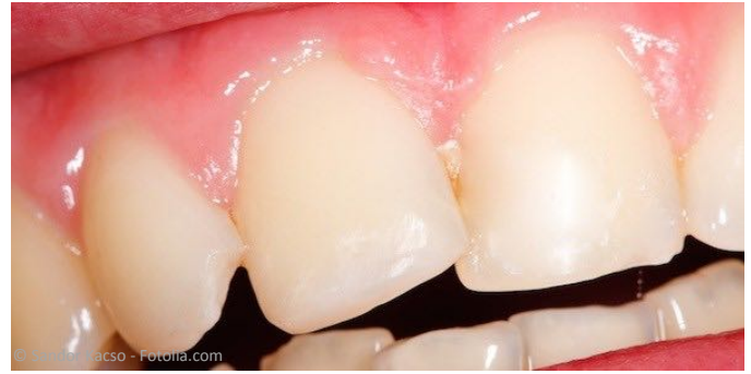
Nachher: Eckenaufbau aus Komposit als Soforthilfe

Manchmal haben Zähne auffällige Schönheitsfehler, die störend wirken: