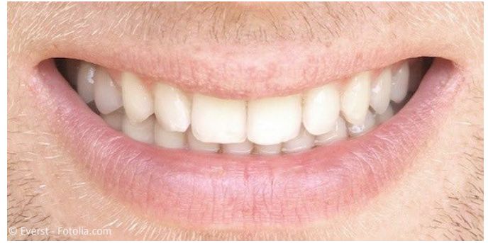
Nachher: Farblich individuell angepasste, geschichtete Komposit-Füllung, die nicht sichtbar ist.

Bei Schneide- und Eckzähnen kommt es besonders darauf an, dass Füllungen nicht sichtbar sind. Das verlangt einige Kunstfertigkeit, weil die Zähne in sich verschiedene Farbnuancen haben: Sie sind im Zahnhalsbereich dunkler und zur Schneidekante hin heller und etwas transparent.