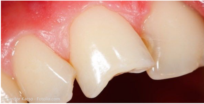
Vorher: Abgebrochene Ecke an einem Schneidezahn