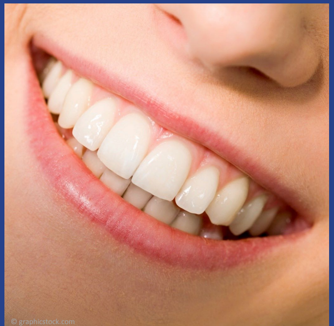
Attraktiv: Glatte Zahnoberflächen ohne Beläge und ein gesundes Zahnfleisch

Persönliche Beratung: Telefon: 09195 - 7062