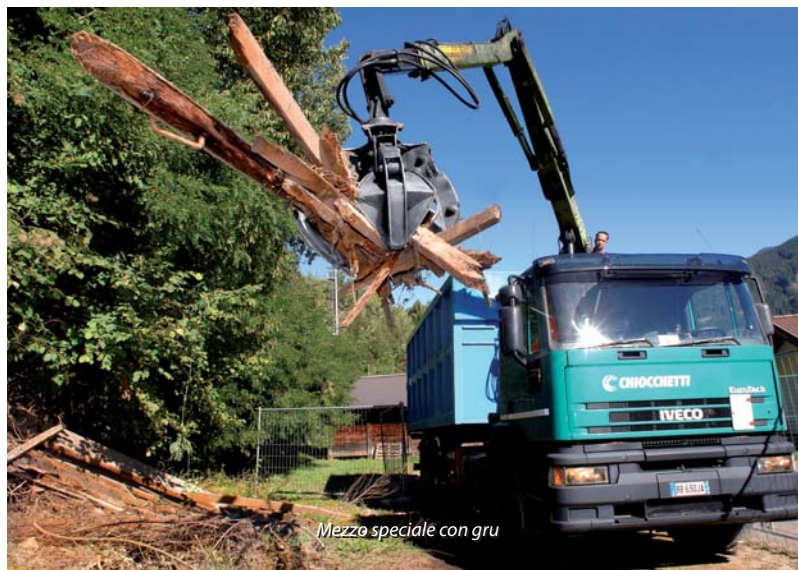
Mezzo speciale con gru

Per le aziende offriamo un servizio personalizzato di raccolta e smaltimento di rifiuti speciali pericolosi (microraccolte) e non pericolosi obbligatori per legge, fornendo idonei contenitori, con ritiri programmati e smaltimento a norma di legge.