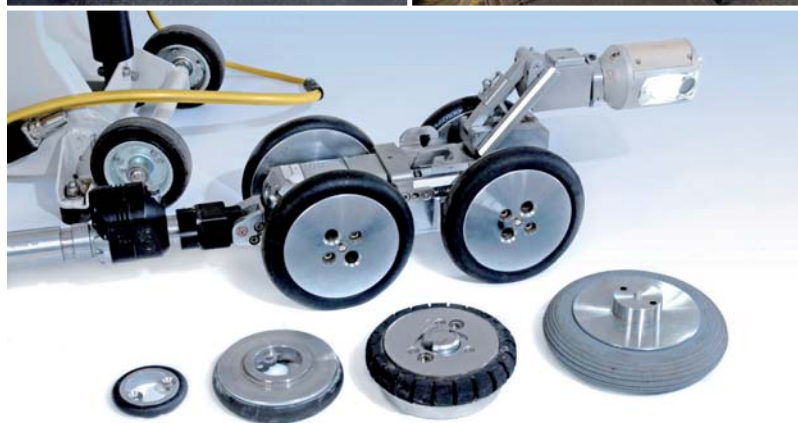
Telecamera a colori robotizzata con joystick