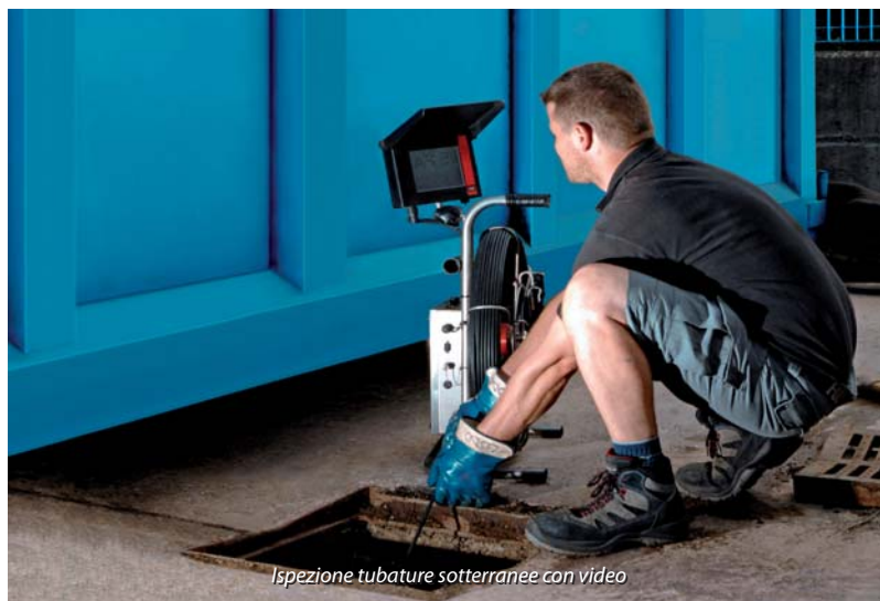
Ispezione tubature sotterranee con video