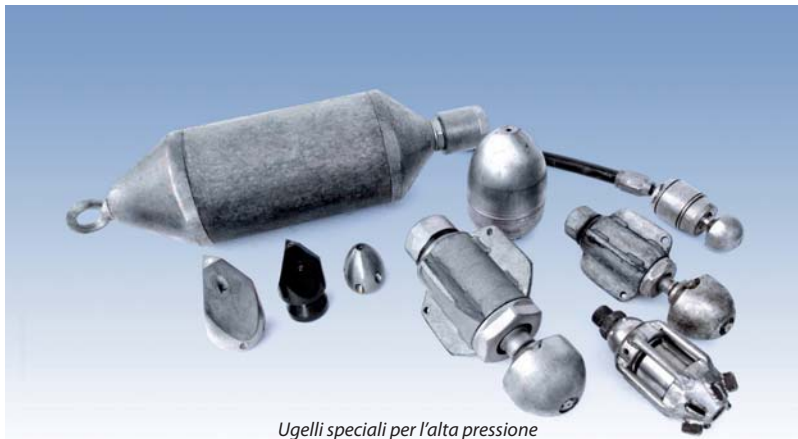
Ugelli speciali per l'alta pressione