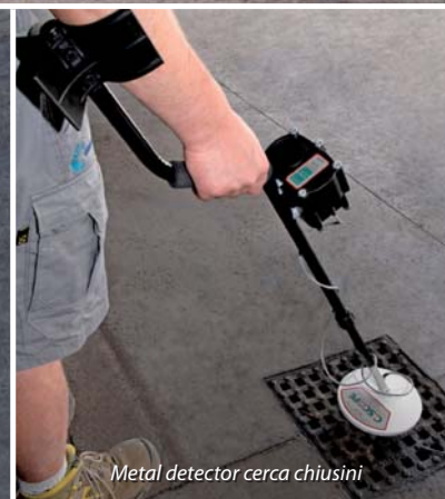
Metal detector cerca chiusini