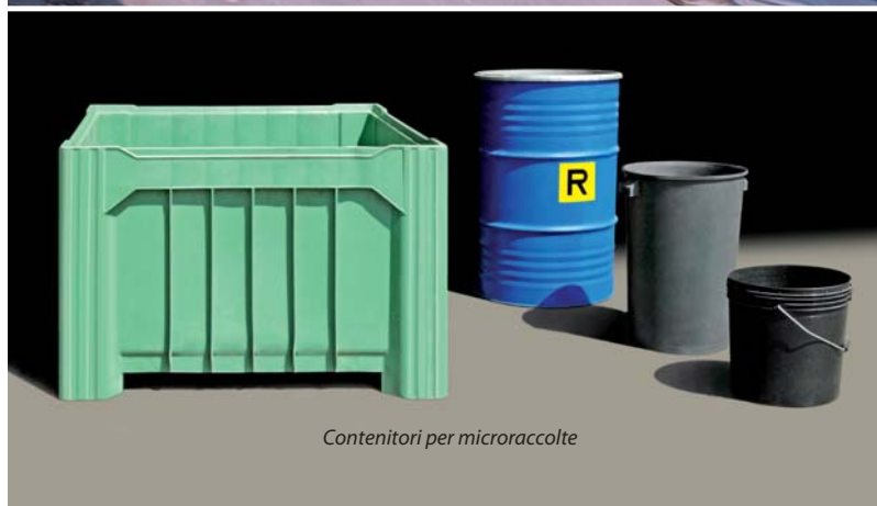
Contenitori per microraccolte