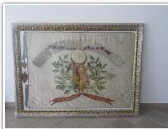
Bandeira original das Tricanas de Vildemoinhos e Cacho Dourado, ganho no Festival de Lisboa em 1937

Toda esta recolha provou-nos que com o espírito trambelo, tudo somos capazes. Posemos mãos à obra, revitalizamos o traje, recolhemos o espólio musical e honrámos a mais importante tradição trambela para as Tricanas de Vildemoinhos – construámos um carro artístico que a 24 de Junho, fará honra deste espírito para as Tricanas. Apresentamos à cidade a “Casa” das Tricanas de Vildemoinhos, trajadas a rigor, com memórias vivas deste rancho e da nossa gente. Neste magnífico carro, que tanto nos orgulha, estão as cores das Tricanas de Vildemoinhos – o laranja do lenço, o verde azeitona da saia, a bandeira original com o cacho dourado ganho em Lisboa e um imponente moral, com fotos das nossas gentes trajadas de Tricanas.