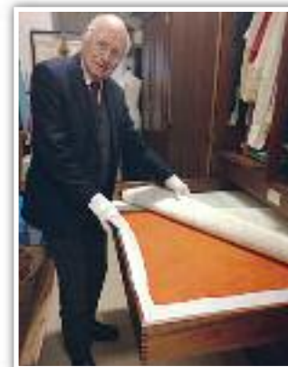
Lenço original das Tricanas de Vildemoinhos, presente no Museu Etnográfico de Passos de Silgueiros – Inspetor Lopes Pires.

Das peças originais, destacamos o lenço presente no Museu Etnográfico de Silgueiros, assim como a roupa interior do traje das Tricanas – saiotos, blusa, colete... que lindas eram as nossas Tricanas e Tricanos. Sim, porque as muitas memórias fotográficas que recolhemos, mostram um grande grupo de homens e mulheres de Vildemoinhos, trajados a rigor, orgulhosos do seu rancho e do seu traje.