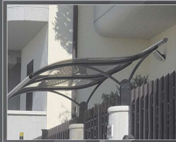
Pensilina Serie "S2"