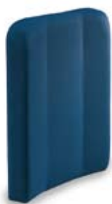
Schienale imbottito sagomato