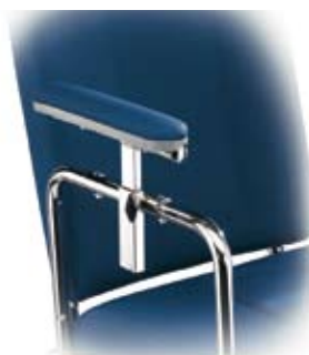
Braccioli regolabili in altezza Codice: 12.24.06.118