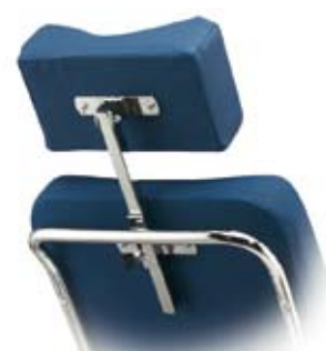
Poggiatesta imbottito regolabile Codice NT: 12.24.06.112