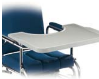
Vassoio incavo universale Codice NT: 12.24.15.106