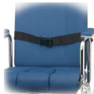
Cintura pettorale normale Codice NT: 12.24.06.103