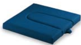
Sedile comoda normale