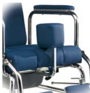
Cuneo divaricatore Codice: 12.24.06.106