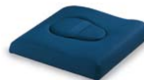
Sedile sagomato con foro ovale