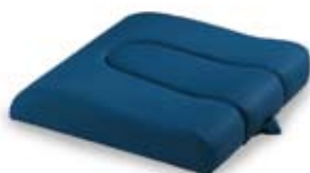
Sedile sagomato normale