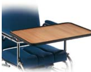
Vassoio normale Codice NT: 12.24.15.103