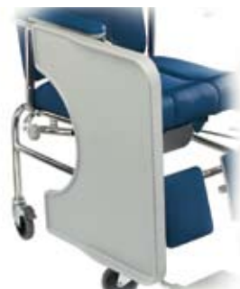
Vassoio incavo ribaltabile Codice NT: 12.24.15.106