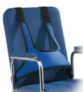
Cintura pettorale con bretelle Codice NT: 12.24.06.139