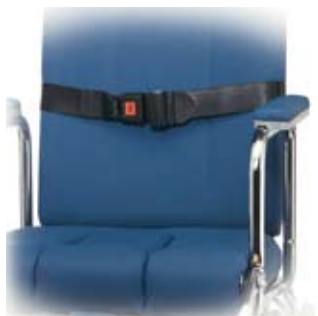
Cintura pettorale a scatto Codice NT: 12.24.06.103