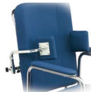
Cuscinetti laterali di spinta Codice: 12.24.06.109