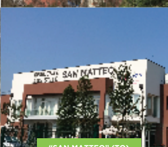
"SAN MATTEO" (TO)