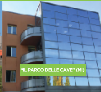
"IL PARCO DELLE CAVE" (MI)