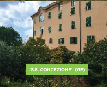
"S.S. CONCEZIONE" (GE)