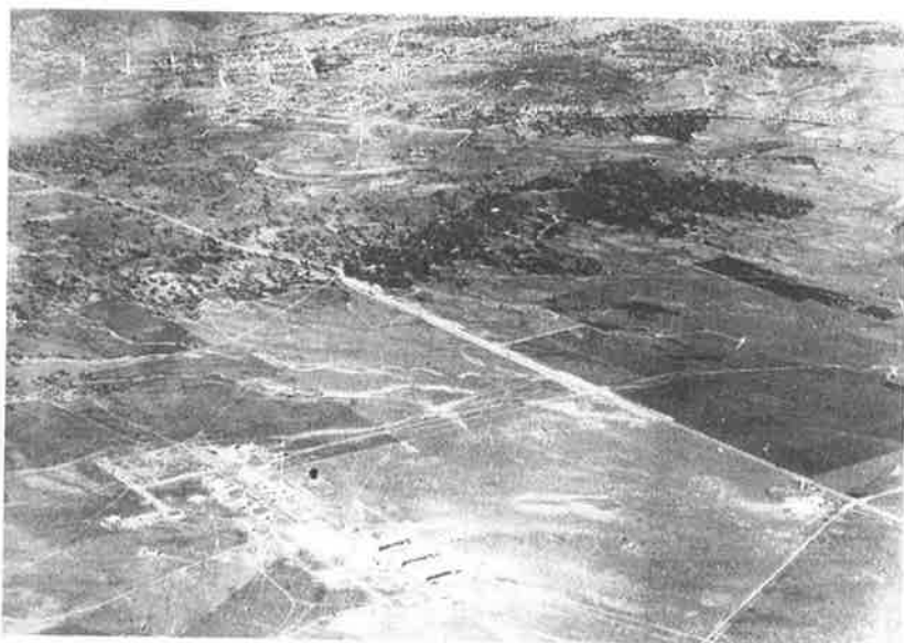
Het vliegveld Canberra (RAAF station) met de stad Canberra op de achtergrond.