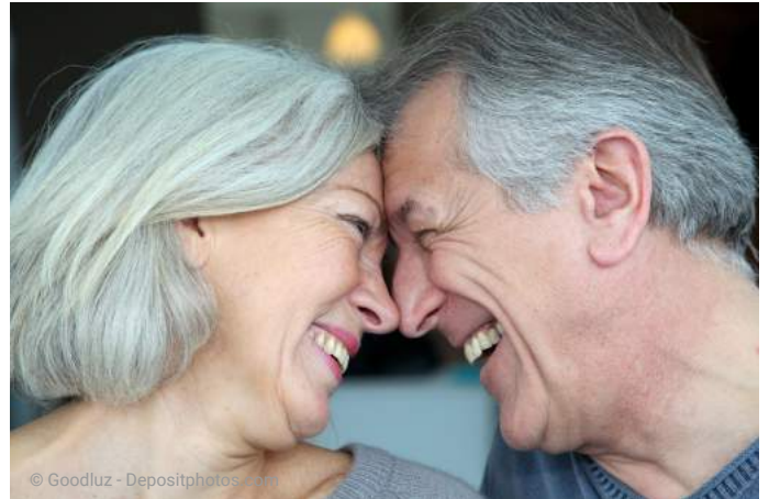
Implantate können bei guter Pflege und Gesundheit 30 Jahre und länger halten.

Wir empfehlen außerdem regelmäßige Professionelle Implantat- und Zahnreinigungen, um Bakterienbeläge