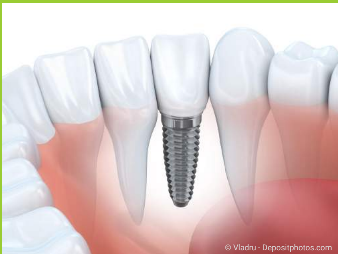
Implantate werden anstelle fehlender Zähne in den Kieferknochen eingesetzt.

Implantate sind künstliche Zahnwurzeln, die anstelle fehlender Zähne in den Kieferknochen eingesetzt werden und nach dem Einheilen so fest wie eigene Zähne sind.