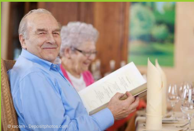
In vielen Fällen können Totalprothesen ganz durch festsitzende Brücken auf Implantaten ersetzt werden. Damit kann man wieder essen wie mit eigenen Zähnen.

Es gibt Menschen, die sich gar nicht mit ihrem herausnehmbaren Zahnersatz abfinden können: