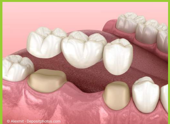
Zahnbrücke: Die Nachbarzähne der Lücke müssen abgeschliffen werden. Bei Implantaten mit Kronen ist das nicht erforderlich.