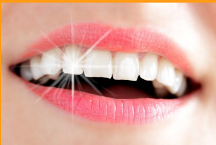
Weiße Zähne mit Bleaching (Zahnaufhellung)