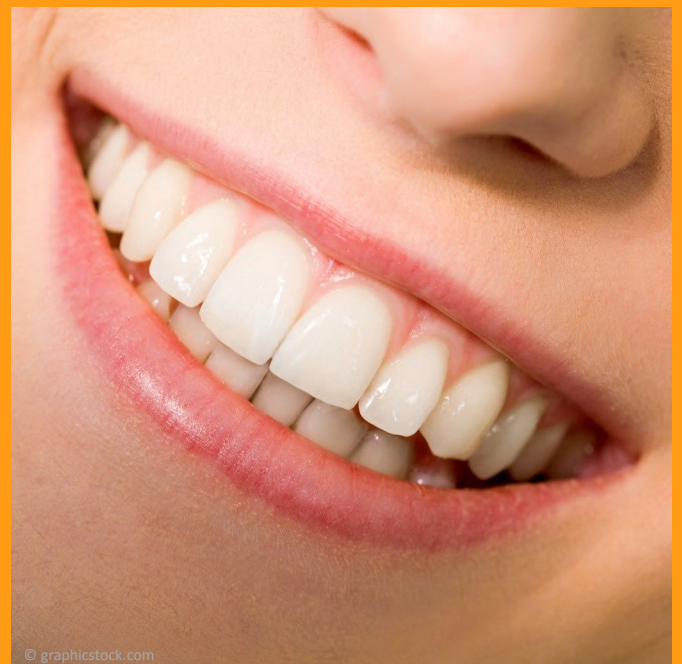
Attraktiv: Glatte Zahnoberflächen ohne Beläge und ein gesundes Zahnfleisch