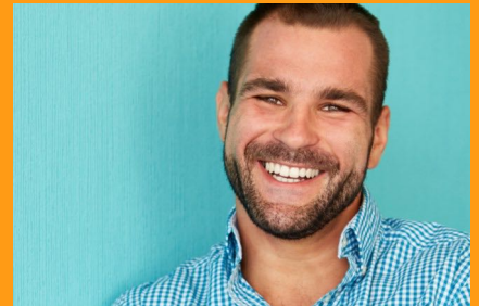
Unsichtbare Zahnfüllungen aus Komposit & Keramik